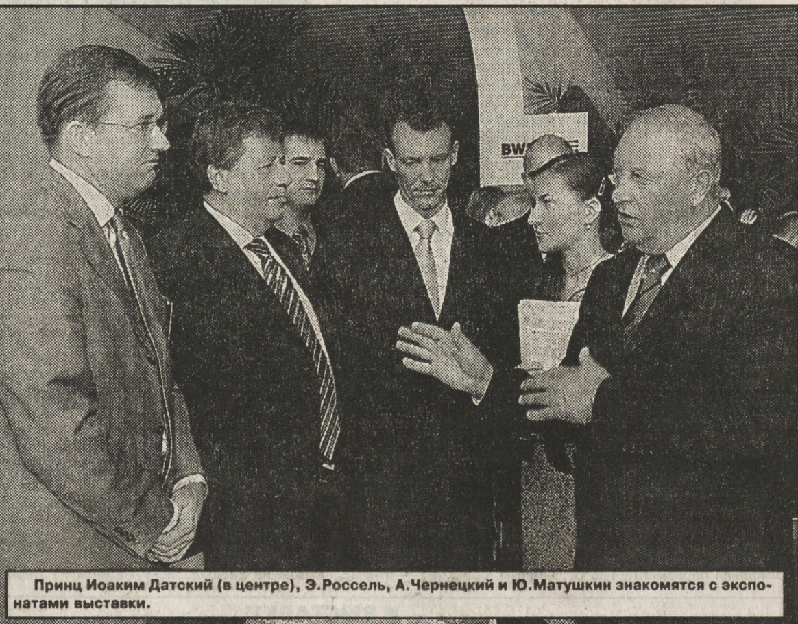
Принц Иоаким Датский (в центре), Э.Россель, А.Чернецкий и Ю.Матушкин знакомятся с экспонатами выставки.

переработке сельскохозяйственной продукции и производству продуктов питания.