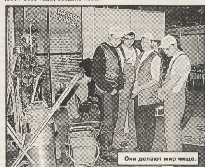
Они делают мир чище.