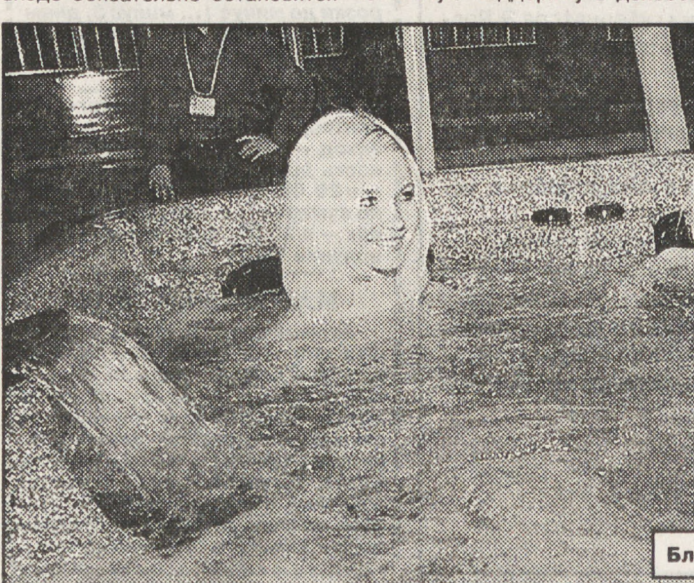
Блондинки — за мини-бассейны.