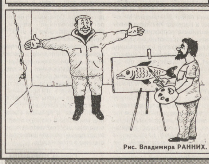
Рис. Владимира РАНИХИ.

Погода По данным Уральского гидрометцентра, 22 сентября в северных районах области пройдут небольшие дожди, в южных районах области будет преимущественно сухо. Температура воздуха ночью плюс 1... плюс 6, на почве местами заморозки до минус 1... минус 3, днем плюс 11... плюс 16, в северных районах области до плюс 8 градусов.