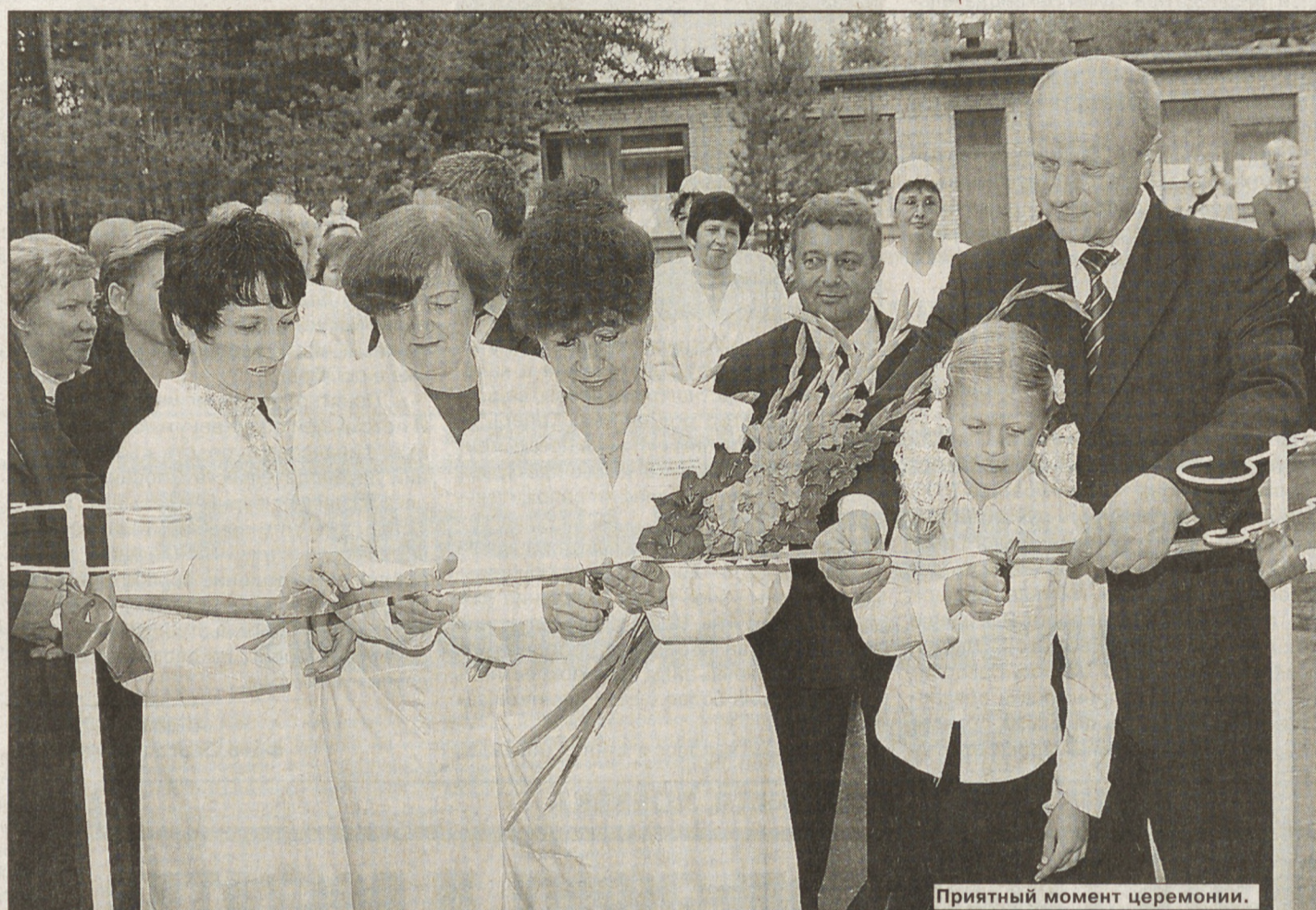
Приятный момент церемонии.