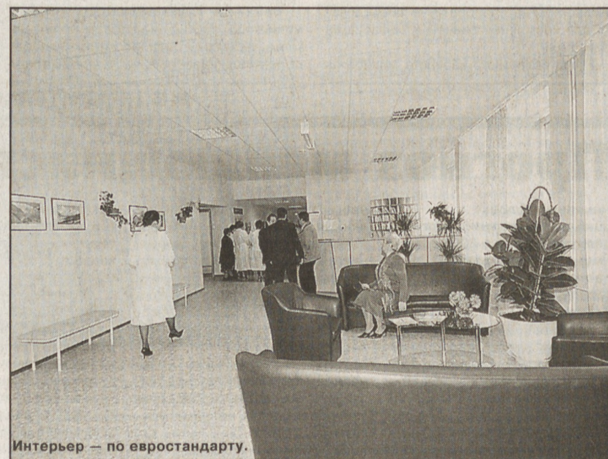
Интерьер — по евростандарту.