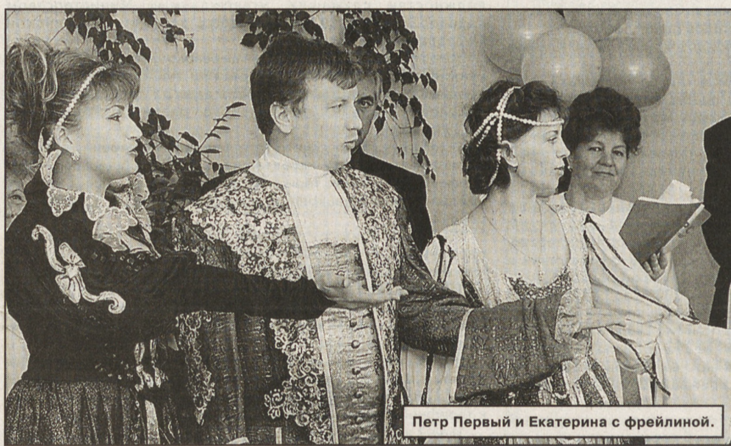
Петр Первый и Екатерина с фрейлиной.