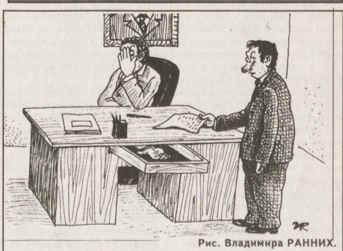
Рис. Владимира РАННИХ.

Погода По данным Уралгидрометцентра, 17 сентября ожидается переменная облачность, местами пройдут кратковременные дожди. Ветер юго-западный, 4–9 м/сек. Температура воздуха ночью плюс 5... плюс 10, днем плюс 16... плюс 21 градус.