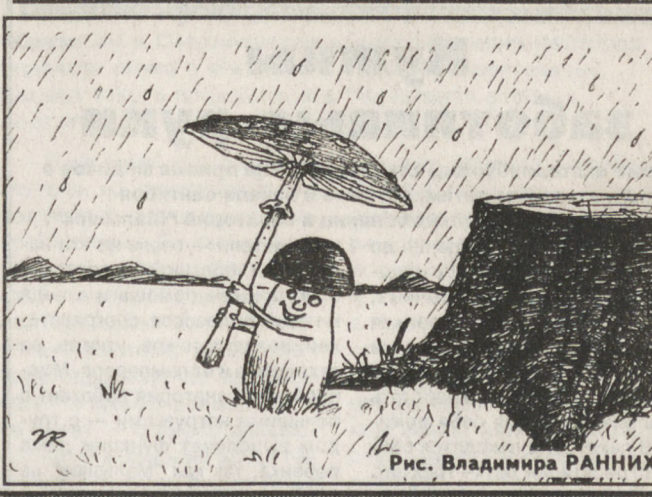
Рис. Владимира РАНИХ.

По данным Уралгидрометцентра, 15 сентября при незначительной облачности воздух днем прогреется до плюс 15... плюс 20, ночью будет прохладнее — плюс 2... плюс 7, когда — заморозки на поверхности почвы до минус 2 градусов. Ветер южный, 4–9 м/сек., осадков не ожидается.