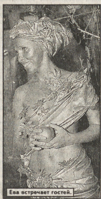
Ева встречает гостей.