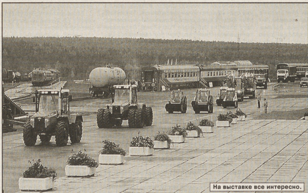
На выставке все интересно.

Андрей ЯЛОВЕЦ.