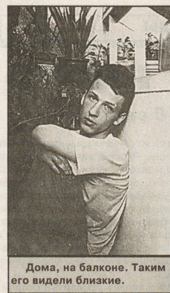
Дома, на балконе. Таким его видели близкие.

На вечер, например, звучало много песен на стихи Б.Рыжего. Казалось бы, музыкальность его поэзии даже предполагает этот ход (профессионалы-филологи, вообще, выяснили уже, что самое частое слово в стихах Рыжего — "музыка"). Но! Запоминающихся стихов-мелодий, за редким исключением, не было. Даже несколько (!) вариантов разных авторов на известное и многими любимое стихотворение "Я тебе привезу из Голландии Lego..." скользнули мимо души. Поэзия Б.Рыжего словно сама отторгает и примитивную иллюстративность, и, напротив, попытки создать на ее основе "нечто свое", "новое". Не получается. И потому не случайно, должно быть, именно с песенной части вечера слушатели начали "иставить" в зале. Пока стихи Бориса больше хочется воспринимать так, как они были созданы. Либо — в одиночестве, молча, "с листа". Либо — на слух, но — без второго голоса. Всякое вмешательство, спутничество оказывается чужеродным поэзии Б.Рыжего. Почему? Скорее всего — это тоже вопрос для филологов.