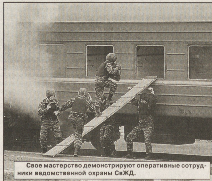
Свое мастерство демонстрируют оперативные сотрудники ведомственной охраны СаЖД.