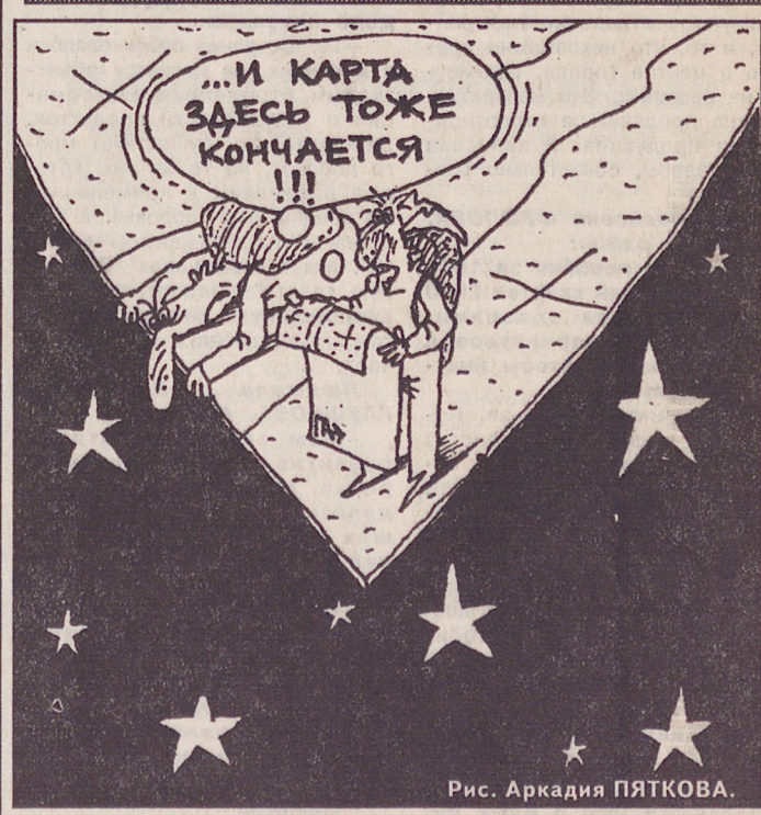
Рис. Аркадия ПЯТКОВА.

В ближайшие дни по области ожидается преимущественно сухая погода, лишь на востоке области 9 августа возможны небольшие кратковременные дожди. Ветер западный 3-8 м/сек. Температура воздуха ночью плюс 7... плюс 12, днем плюс 18... плюс 23 с дальнейшим повышением температуры на 3-4 градуса.