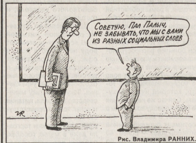
Рис. Владимира РАНИХИ.

По данным Уралгидрометцентра, 1 сентября ожидается переменная облачность, преимущественно без осадков. Ветер юго-восточный, 4–9 м/сек. Температура воздуха ночью плюс 6... плюс 11, днем плюс 14... плюс 19 градусов.