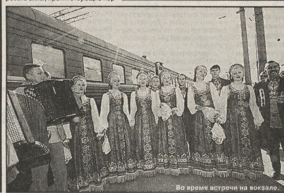
Во время встречи на вокзале.