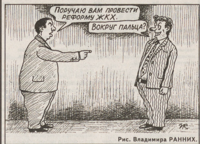
Рис. Владимира РАНИХ.

По данным Уралгидрометцентра, 28 августа в южных районах области вновь пройдут кратковременные дожди, на севере области осадков не ожидается. Ветер северо-восточный, 6—11 м/сек. Температура воздуха ночью плюс 6... плюс 11, днем плюс 14... плюс 19 градусов.