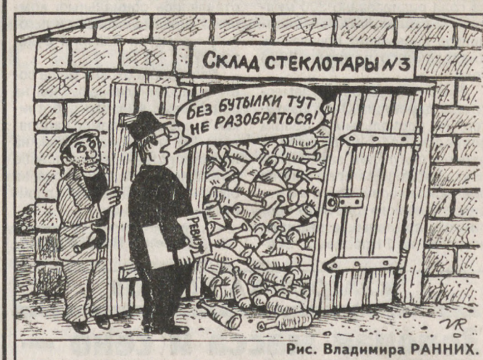
Рис. Владимира РАНИХ.

По данным Уралгидрометцентра, 25 августа ожидается переменная облачность, преимущественно без осадков. Ветер северо-восточный, 4–9 м/сек. Температура воздуха ночью плюс 4... плюс 9, днем плюс 13... плюс 18 градусов.