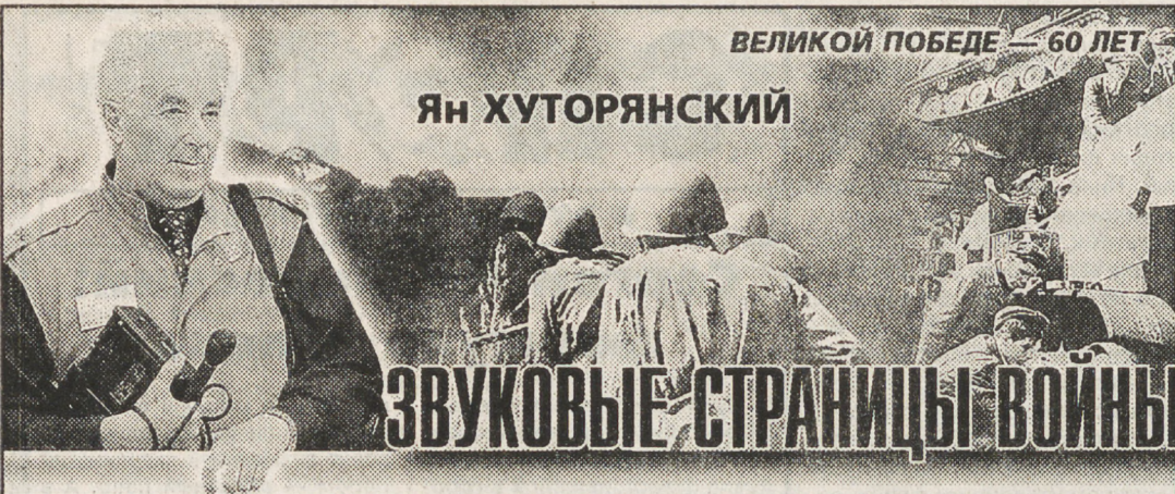
ВЕЛИКОЙ ПОБЕДЕ — 60 ЛЕТ