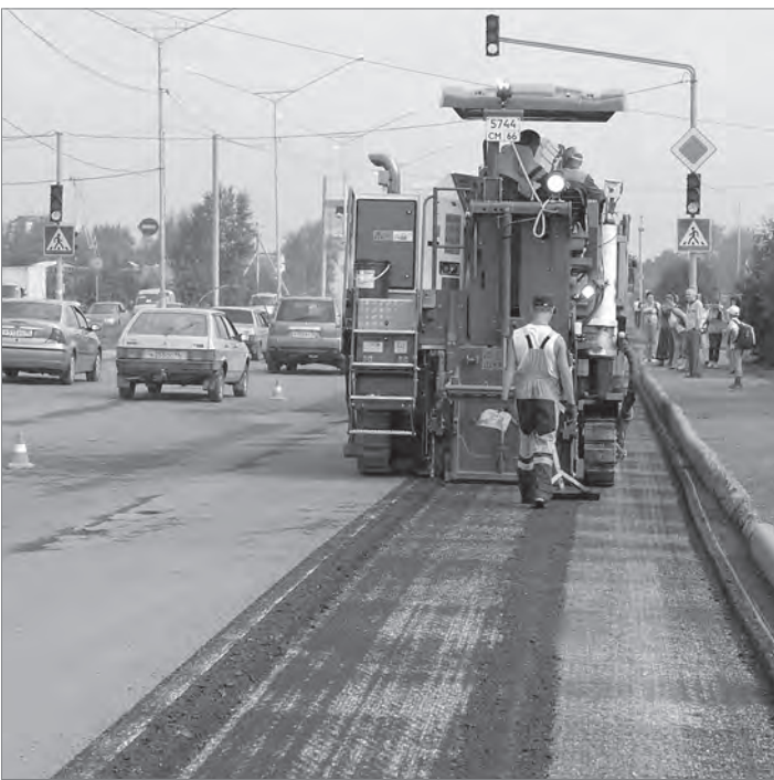
На Черноисточинском шоссе.

Невероятно, но факт: нынешним летом строительство и ремонт автомобильных дорог идет в Нижнем Тагиле с опережением графика. Это подтвердили на совещании у главы города и в ходе объезда объектов реконструкции.