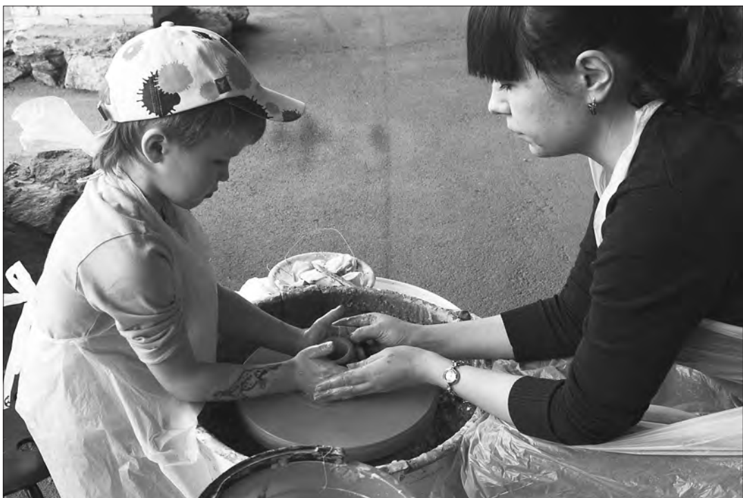
Здесь каждый может слепить сувенир из глины.