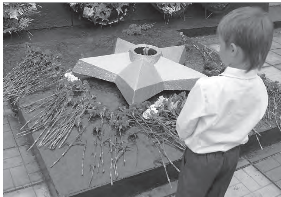
Возложение цветов к Вечному огню.