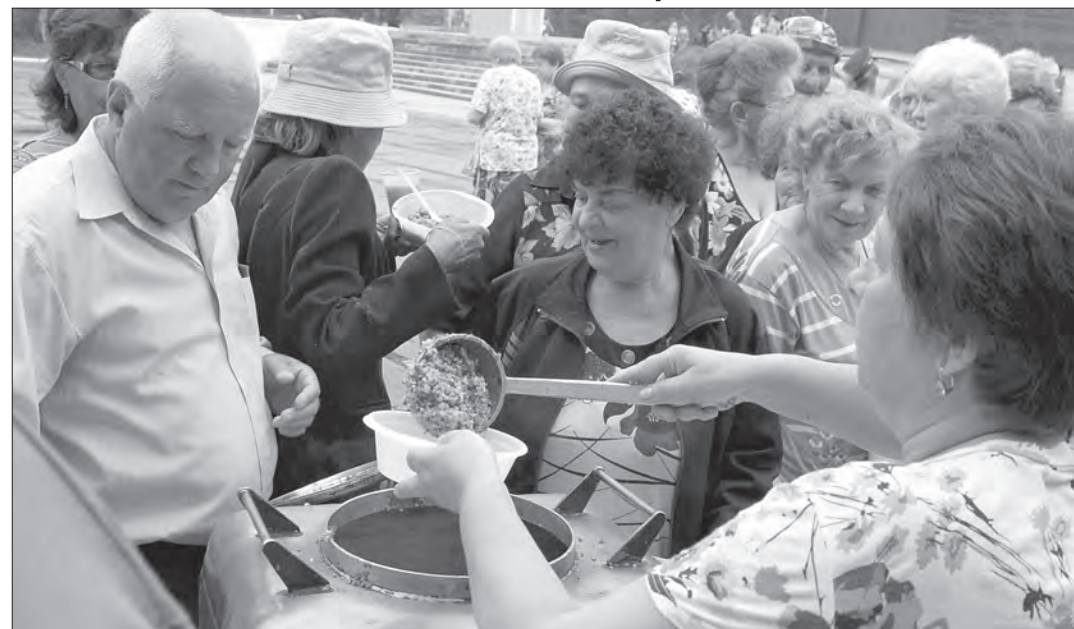
Ветеранов угощают кашей.