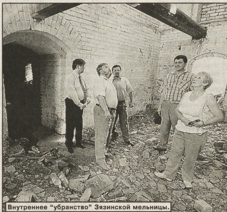
Внутреннее "убранство" Язынской мельницы.