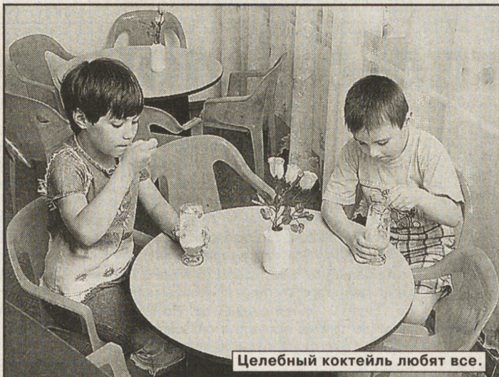
Целебный коктейль любят все.

Тагила, таких немало, установлена гаюлкамера — микроклимат соляной пещеры способствует скорейшему выздоровлению. Отдельно стоит сказать о физкабинете — это последнее слово в медтехнике, в нем есть все, что необходимо для профилактических и оздоровительных процедур.