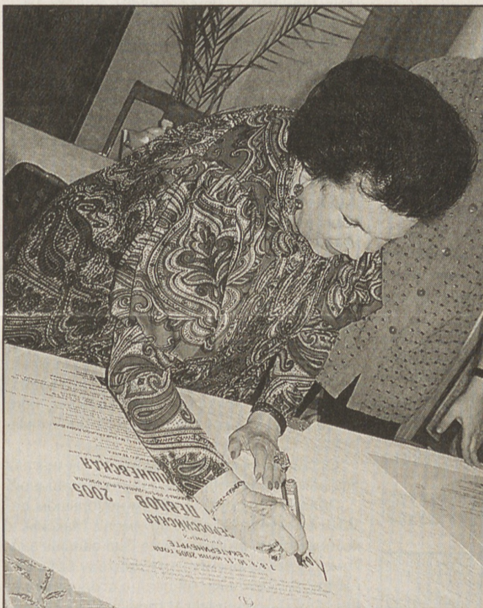
Автограф Г. Вишневской. Теперь эта афиша висит в редакции "Областной газеты".

— Галина Павловна, за рубежом рынок и искусство давно сосуществуют вместе. В России же искусство только только приноравливается к законам коммерции. Чего же