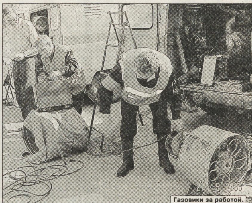
Газовики за работой.

— Без преувеличения, все было проведено на высочайшем профессиональном уровне. Об этом говорит и тот факт, что запуск газопровода провели намного раньше запланированного срока. Отключили подачу четвертого июля, а восьмого в газопроводе уже был газ. В субботу, девятого июля, начали подключать жилой сектор. Жители Красноуральска отреагировали сразу: специалисты предупреждали, что до 20 числа не будет газа, а он пошел в дома уже 11! Это здорово! — дал