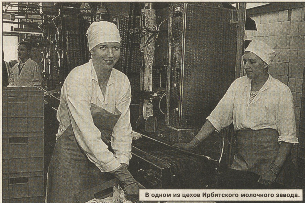
В одном из цехов Ирбитского молочного завода.