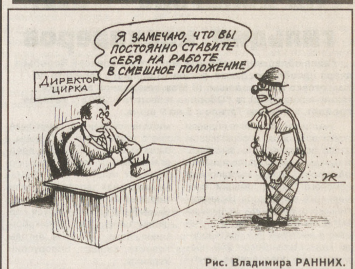
Рис. Владимира РАННИХ.

По данным Уралгидрометцентра, завтра ожидается переменная облачность, временами дожди, местами грозы. Ветер северо-западный, 3–8 м/сек, при грозах порывы до 15 м/сек. Температура воздуха ночью до плюс 11... плюс 16, днем плюс 18... плюс 23 градуса.