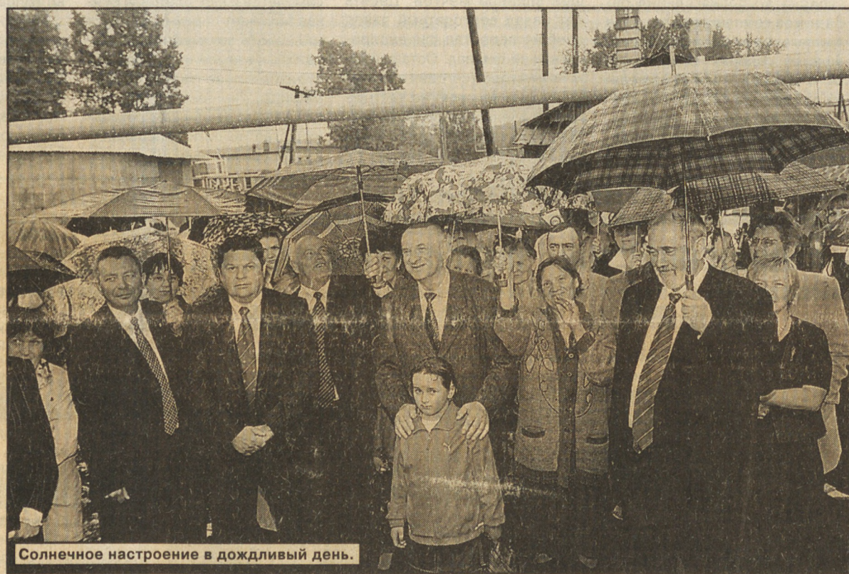
Солнечное настроение в дождливый день.

Очень удобно для селян то, что теперь на месте можно сдать все первичные анализы, проверят медики ОВП и уровень сахара в крови, снимут кардиограмму. Предусмотрен дневной стационар — в случае необходимости все процедуры тут же проведут. Для докторов же важно, что есть возможность неплохо зарабатывать — до 10-15 тысяч рублей. Но размер зарплаты будет зависеть от того, насколько активно ведутся профилактическая работа и наблюдение за хроническими