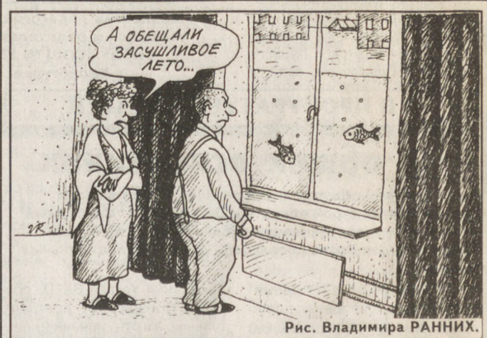
Рис. Владимира РАНИХИ.

Погода По данным Уралгидрометцентра, завтра фронтальный раздел циклона, сместившись к нам с юго-запада России, вновь испортит погоду в нашей области. Ветер западный, 3–8 м/сек. Местами пройдут дожди. Температура воздуха ночью плюс 13... плюс 18, днем плюс 21... плюс 26 градусов.