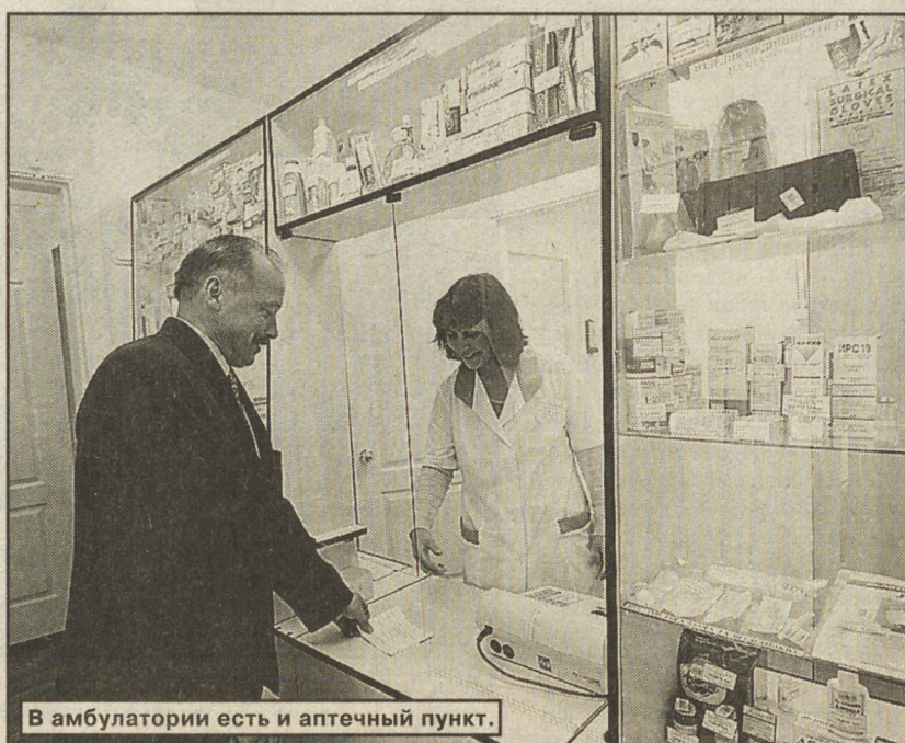
В амбулатории есть и аптечный пункт.