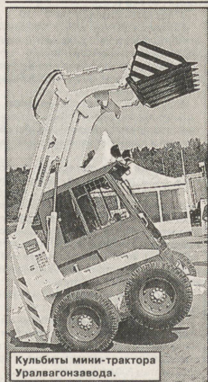
Кульбиты мини-трактора Уралвагонзавода.