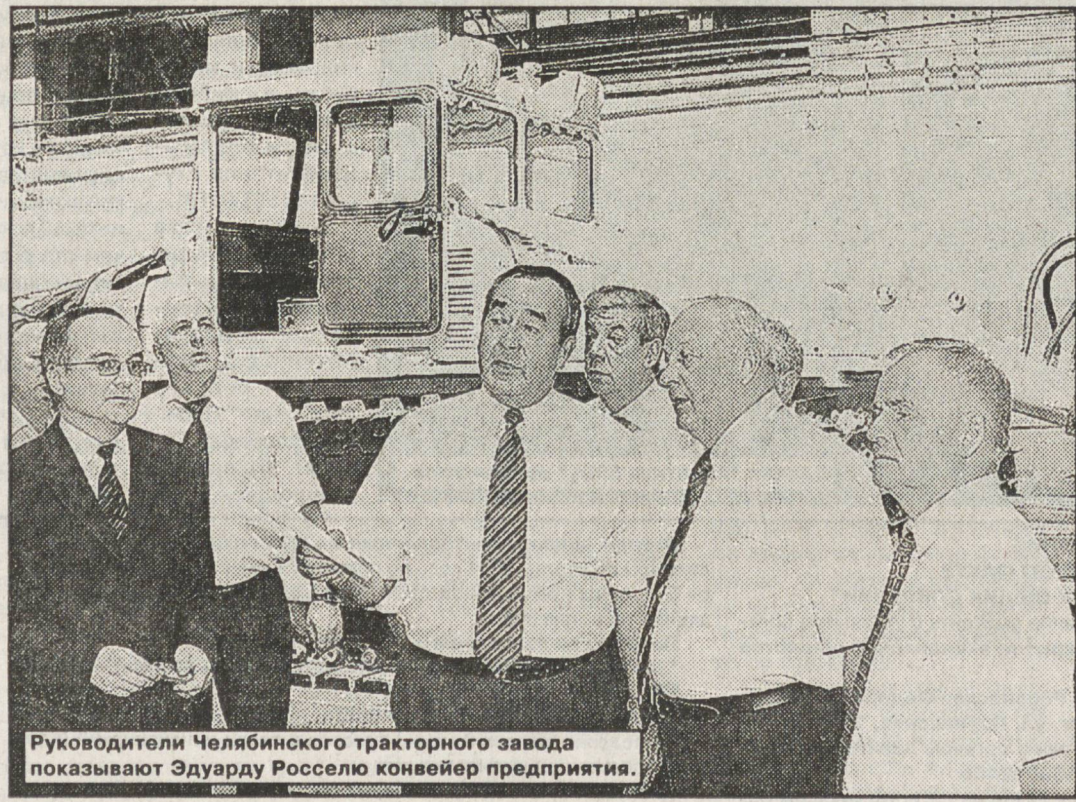
Руководители Челябинского тракторного завода показывают Эдуарду Росселю конвейер предприятия.