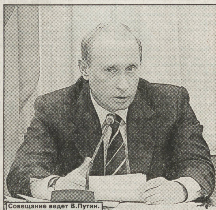
Заседание ведет В. Путин.

Эдуард Россель 16 мая в Челябинске принял участие и выступил на заседании по проблемам социально-экономического развития Урала, которое проводил Президент Российской Федерации Владимир Путин.