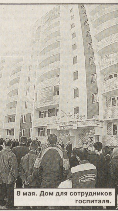
8 мая. Дом для сотрудников госпиталя

Тамара ВЕЛИКОВА.