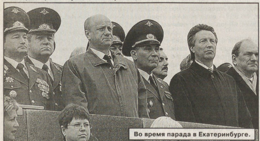
Во время парада в Екатеринбурге.