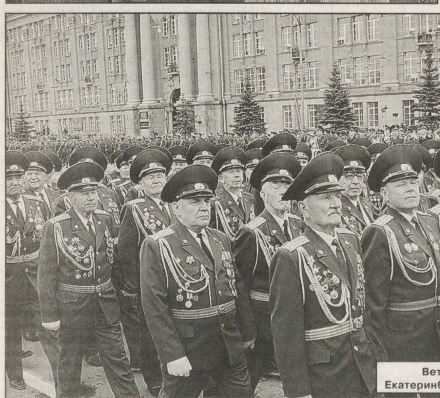
Ветераны — в строю! Екатеринбург. 9 мая 2005 г.