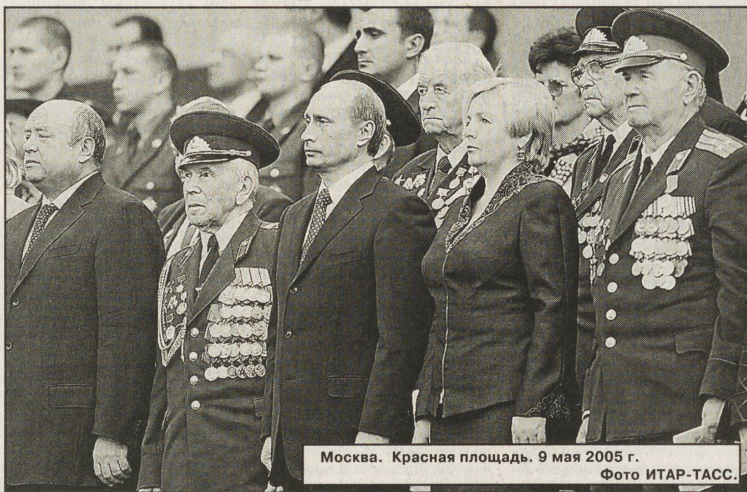
Москва. Красная площадь. 9 мая 2005 г.

Президент России Владимир Путин выступил с речью перед началом торжественного парада на Красной площади.