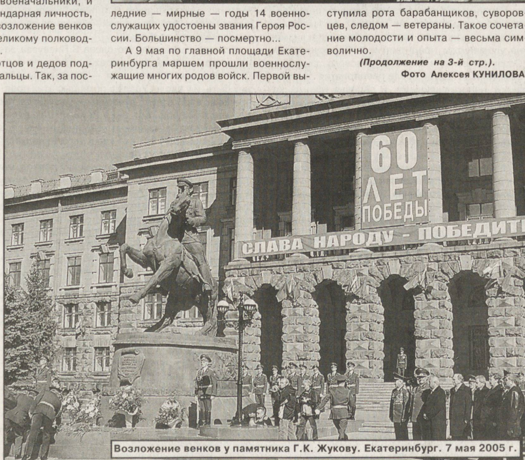
Возложение венков у памятника Г.К. Жукову. Екатеринбург. 7 мая 2005 г.