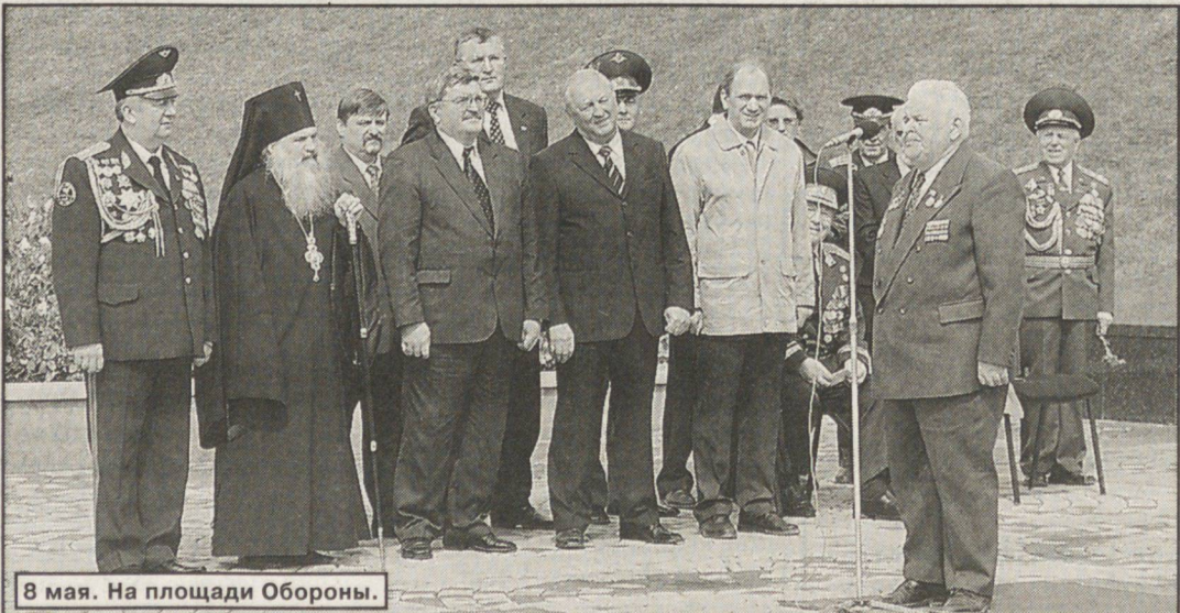
8 мая. На площади Обороны.