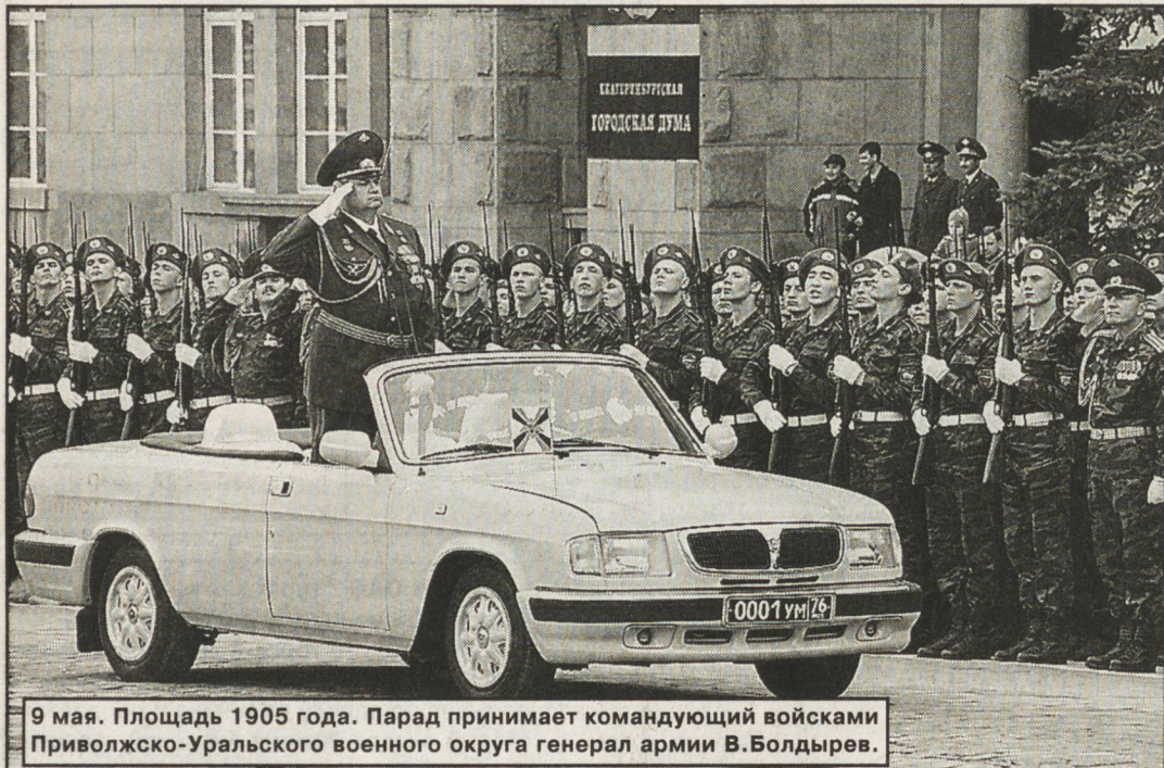
9 мая. Площадь 1905 года. Парад принимает командующий войсками Приволжско-Уральского военного округа генерал армии В.Болдырев.