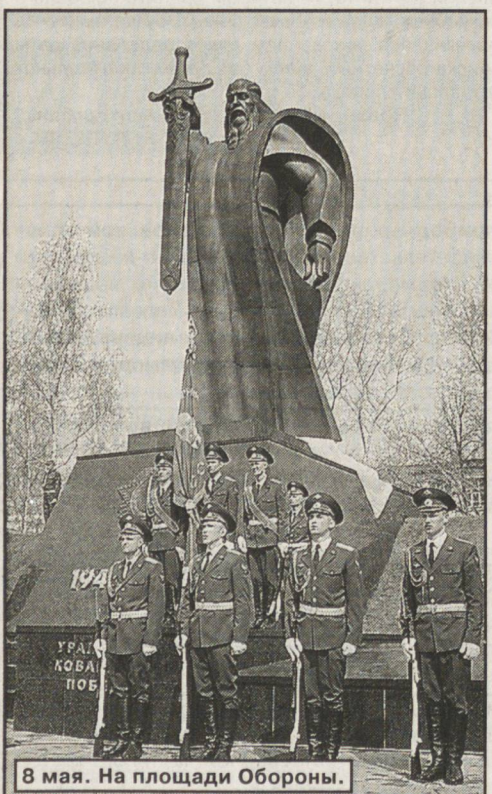
8 мая. На площади Обороны.

— Это для меня самый святой праздник. У нас в роду многие воевали: деды, дядьки — практически все старшие родственники. Сам я родом из города Грозного — мне как военному много пришлось поехать и по нашей стране, и по территории других государств... А сегодняшнюю дату я воспринимаю как самое дорогое в жизни событие.