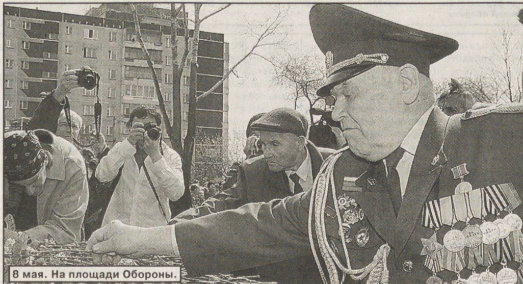
8 мая. На площади Обороны.

Губернатор с гордостью напомнил о том, что на Урале в годы войны ковалось оружие Победы. Серовский металлургический завод — единственная в Совет-