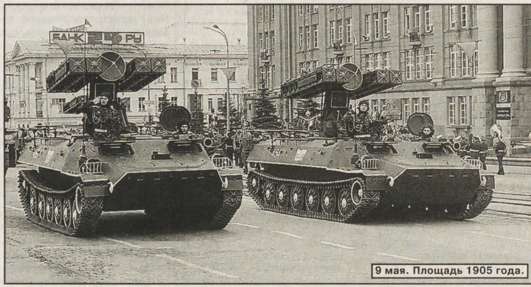
9 мая. Площадь 1905 года.

Участник парада подполковник Виталий Остапенко (управление Приволжско-Уральского военного округа):