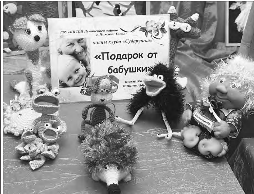
Тактильные игрушки, изготовленные членами клуба «Сударушка».

В день проведения двух последних туров в фойе пансионата было многолюдно. Посетители с интересом