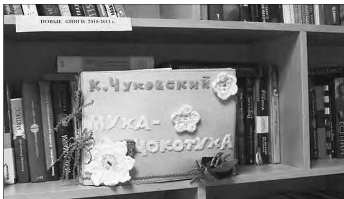
«Муха-Цокотуха» сделана шестиклассниками гимназии №18.