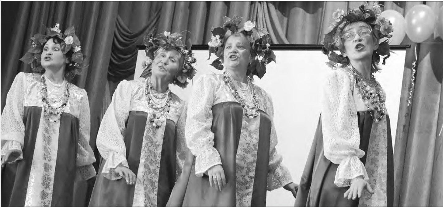
Выступает квартет Ленинского района.