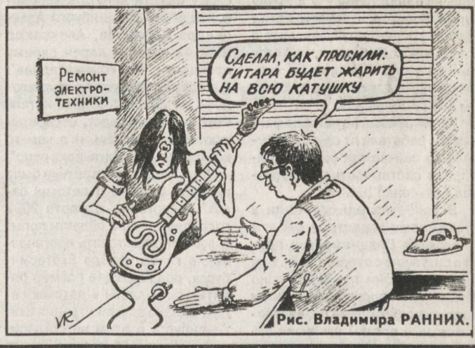
Рис. Владимира РАННИХ.

10 апреля ожидается малооблачная погода без осадков. Температура воздуха ночью 0... плюс 5, днем плюс 10... плюс 15, ветер западный, 2-7 м/сек.