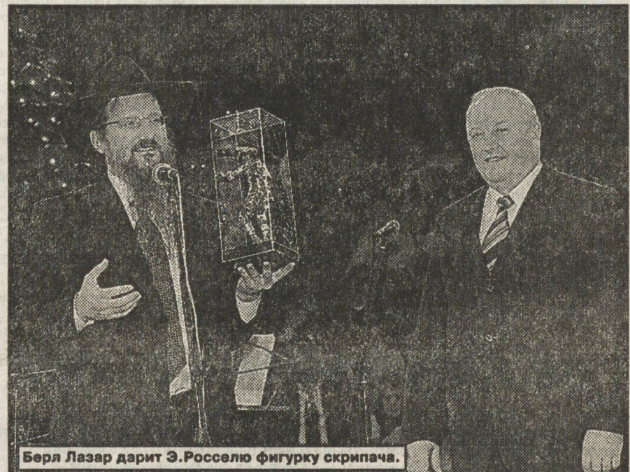
Берл Лазар дарит Э.Росселю фигурку скрипача.

— Еврейская община объединяет около 30 тысяч человек, проживающих в Свердловской области, имеет филиалы в 12 горо-