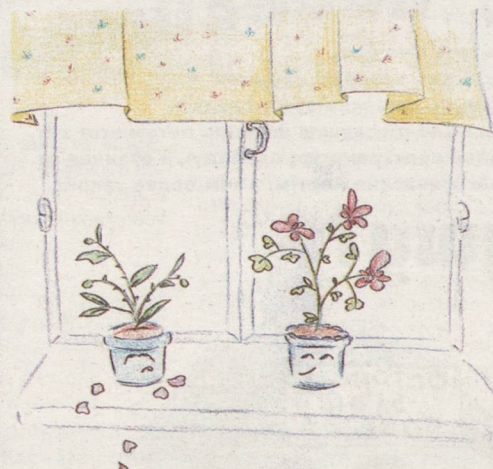
Рисунок Ольги БРЫНЦЕВОЙ.

Катя САДЫКОВА, 17 лет. пгт. Баранчинский.