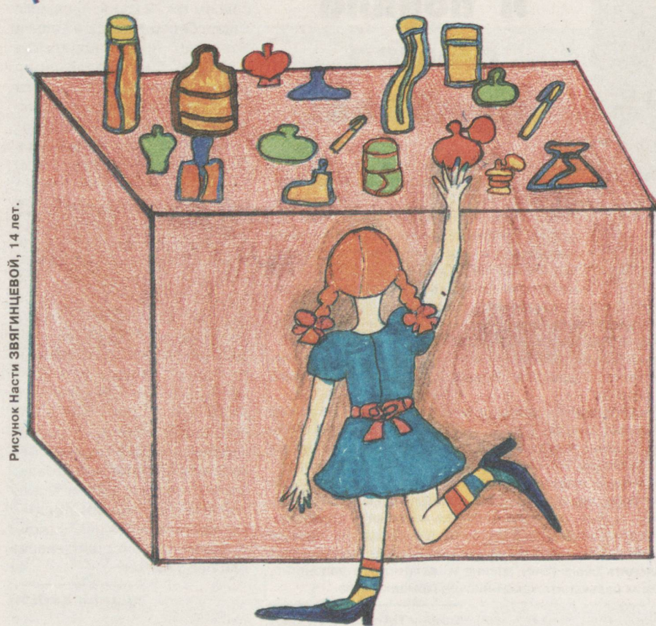
Рисунок Насти ЗВЯГИНЦЕВОЙ, 14 лет.