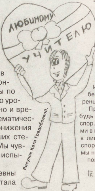
Рисунок Кати Градобоевой.

В нашем 11-м классе шесть девочек: Света, Таня, Надя, Катя, Катя и еще одна Катя (то есть я). Из-за того, что у нас в классе три Кати, случаются довольно смешные истории.