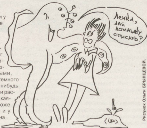
Рисунок Ольги БРЫНЦЕВОЙ.

сложится ее дальнейшая судьба; мечтает и раздумывает о дружбе, любви и счастье.