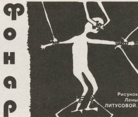
Рисунок Лены ЛИТУСОВОЙ.