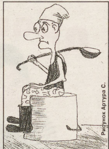
Рисунок Артура С.

Занимаюсь спортом, люблю музыку, диско, рэп, люблю хорошо одеваться, выглядеть на 100%.