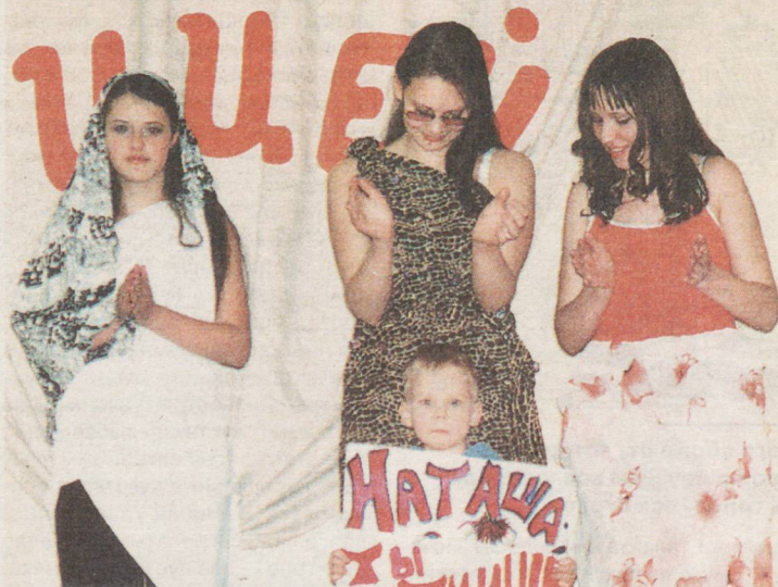
Показ мод, тут без группы поддержки никуда!