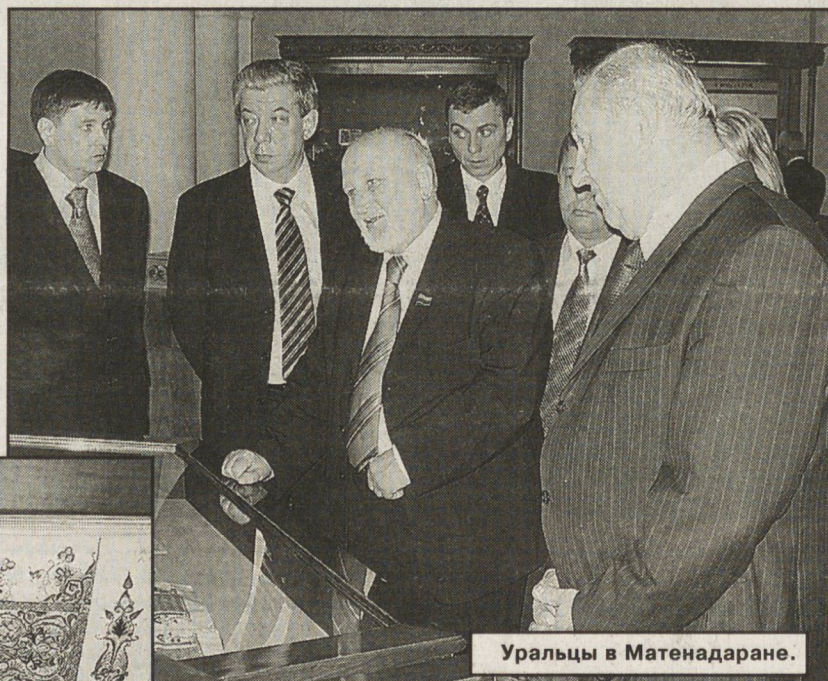
Уральцы в Матенадаране.

В ходе двухдневного визита свердловской делегации была предложена большая и насыщенная программа. Здесь умеют и любят встречать гостей. В Армении множество исторических достопримечательностей, посмотреть которые за двое суток практически невозможно. Тем не менее прикоснуться к многовековой истории государства Урарту нам удалось. Скажем, потрясло посещение Матенадарана — научно-исследовательского института древних рукописей, в котором собрана уникальная коллекция, насчитывающая около 20 тысяч манускриптов. Очень интересным стало посещение в Араратской области священного места, где расположен храм Хор-вираба. Здесь в 301 году новой эры под сенью горы Арарат армяне приняли христианство.