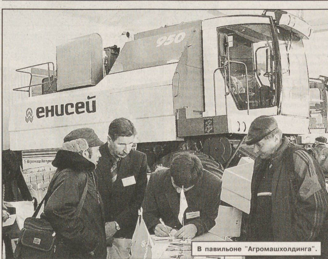
В павильоне "Агромашхолдинга".