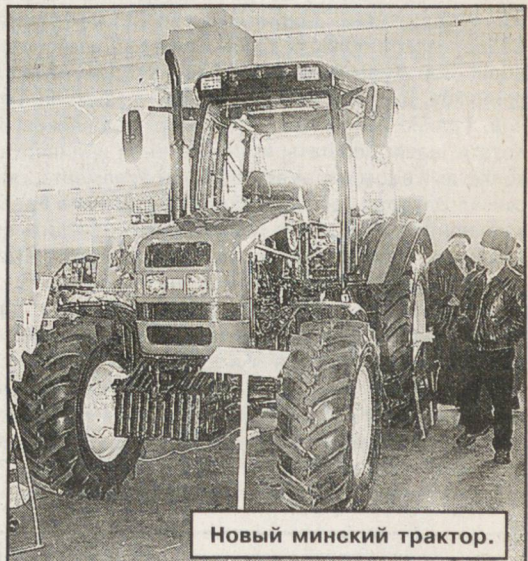
Новый минский трактор.

один проход выполнять восемь операций, и, тем самым, экономить горючее, работают уже в 20-ти районах области.