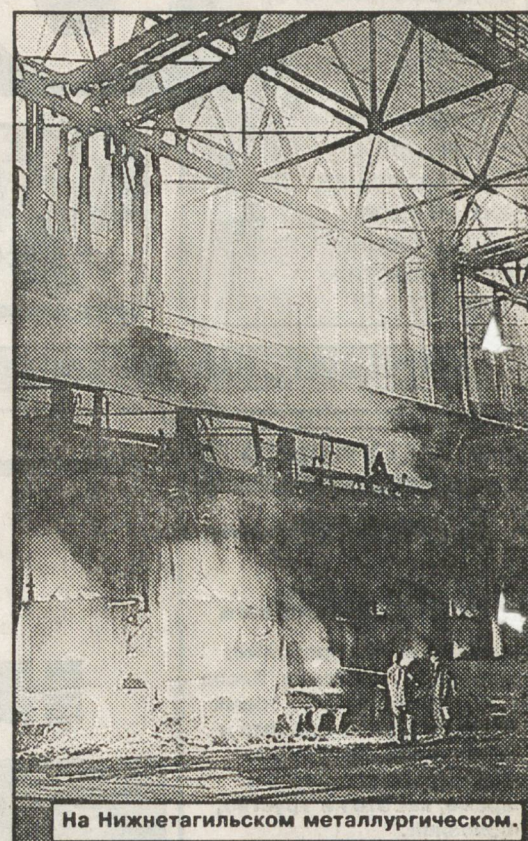
На Нижнетагильском металлургическом.

Радует, что в черной металлургии практически не осталось умирающих заводов, реанимировано даже такое, казалось бы, безнадежное предприятие, как Алапаевский металлургический завод, который восстановлен украинской группой "Приват" и уже дал первую продукцию.