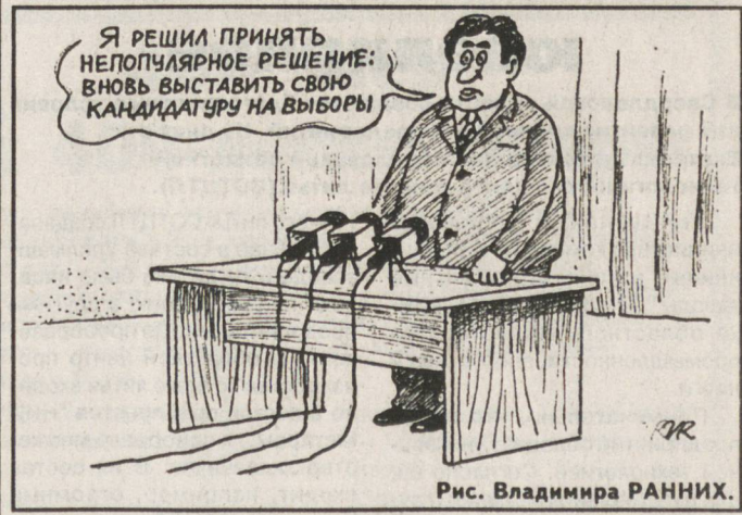
Рис. Владимира РАННИХ.