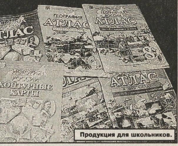
Продукция для школьников.

Жюльерновский Жак Паганель, умудрившийся в карту Америки вклинить Японию, может