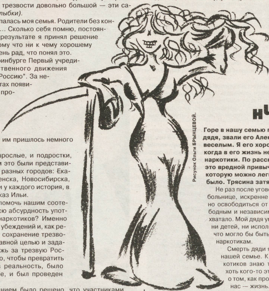
Рисунок Ольги Брынцева.