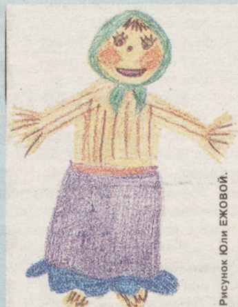
Рисунок Юли ЕЖОВОЙ.

Блины в Масленицу — предмет гордости любой хозяйки. Они и с начинкой, и без, со сметаной, с вареньем, с маслом. Вот уж действительно можно задать "пир на весь мир".