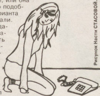
Рисунок Насти СТАСОВОЙ.