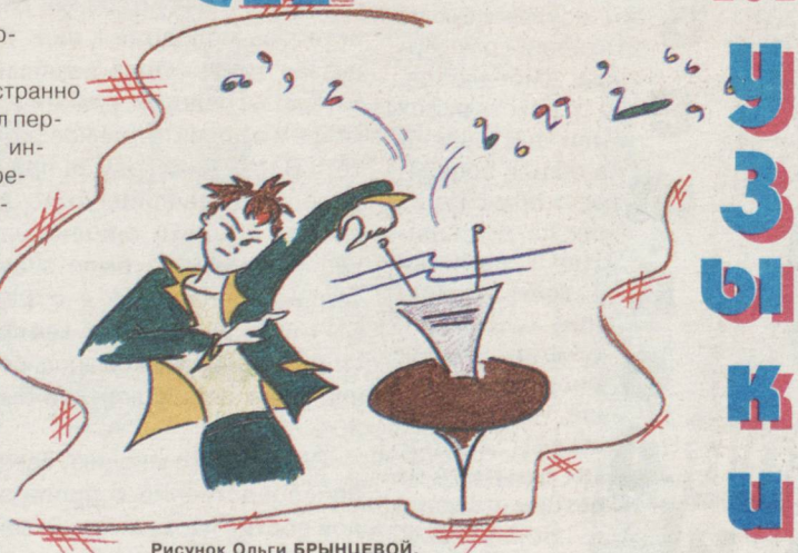
Рисунок Ольги БРЫНЦЕВОЙ.

в последующее время находились под грифом «секретно».