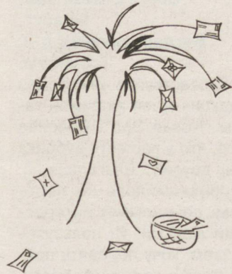
Рисунок Ольги БРЫНЦЕВОЙ.

Я увлекаюсь спортом, люблю гулять, слушать музыку, играю на гитаре. Хочу переписываться с девочками и пацанами моего возраста, отвечу всем.