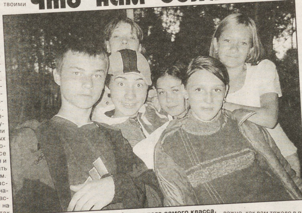
Ребята из того самого класса. Важно, как вам тяжело в плане учебы, помните, что это наш последний совместный год обучения, и дальше наши дороги разойдутся.