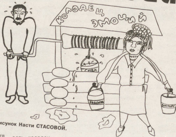
Рисунок Насти СТАСОВОЙ.