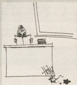
Рисунок Наташи ОРЕХИНОЙ.

—Таких историй было много. Но одну я вспоминаю часто. В один прекрасный день я, как обычно, вела урок. И тут из-под подиума, на котором я стояла, выбежала (кто бы подумал?)... мышка! Животное было ничем не обеспокоено, в отличие от меня и учеников. Мышь пробежала по классу и благополучно вернулась в норку. Я выдержала это испытание с достоинством. Как учитель биологии, я просто должна была показать детям пример. Вообще, педагог должен быть всегда готов к подобным казусам, ведь от работы с детьми можно ожидать чего угодно!