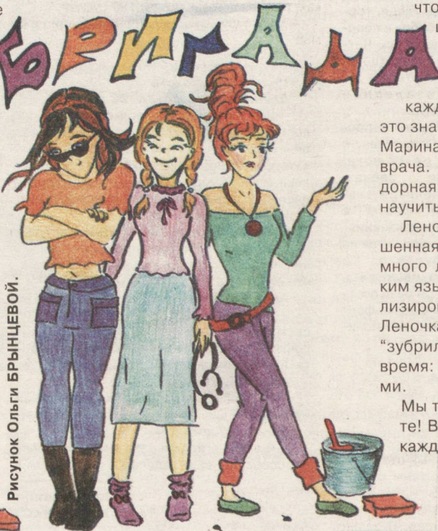
Рисунок Ольги БРЫНЦЕВОЙ .

Итак, знакомьтесь: Аленушка. Она старше нас на год, обладает великолепной интуицией, "рентгеновскими" способностями, видит человека буквально насквозь! Алена — душа компании и может поднять настроение, когда оно на нуле. По характеру рассудительная, уверенная в себе,