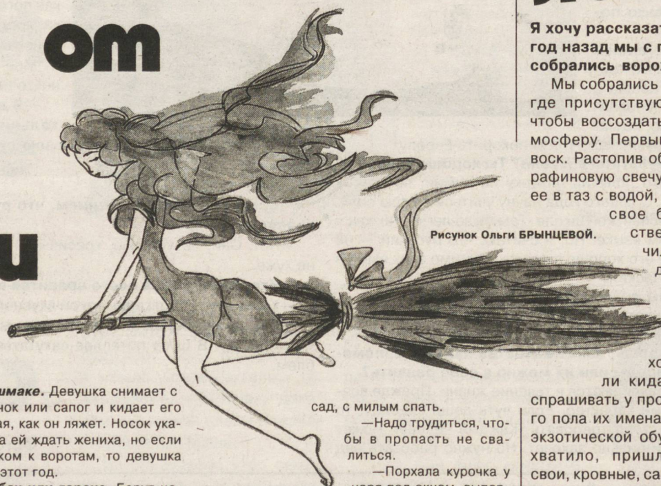
Рисунок Ольги БРЫНЦЕВОЙ.

Предсказания — Сладкий пирог на праздничный стол. — За воротами кони заворожены стоят, сестра бы уехать, домой не бывать. — Жить припеваючи, горя не знать. — Брошу я подушку в зелен сад. В зелен