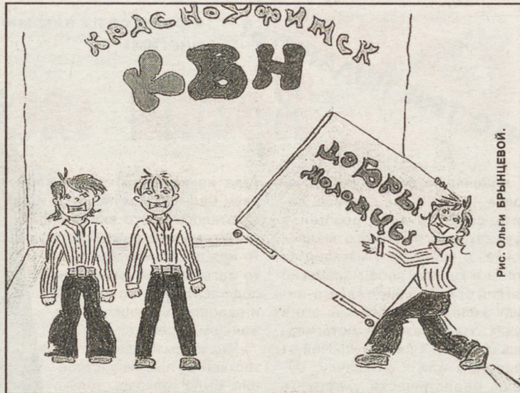
Рис. Ольга Брынцева.