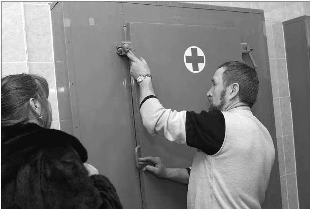
* Санпропускник оснащен новыми дезинфекционными камерами.