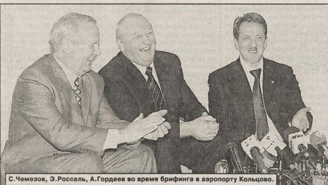
С.Чемезов, Э.Россель, А.Гордеев во время брифинга в аэропорту Кольцово.

Вчера в Свердловской области состоялось выездное расширенное заседание коллегии министерства сельского хозяйства Российской Федерации во главе с министром сельского хозяйства страны Алексеем Гордеевым. Участие в нем принял губернатор Свердловской области Эдуард Россель. Выездная коллегия федерального аграрного ведомства страны — событие отнюдь не рядовое. Нынешняя была посвящена вопросам развития птицеводства. И место проведения её было выбрано не случайно. Вот что об этом сказал сам министр А. Гордеев: — В Свердловской области есть по-настоящему передовые птицеводческие предприятия и есть, что похвалить. Говоря о составе делегации, приехавшей на Средний Урал, он заметил: — Здесь мы собрали руководителей лучших птицефабрик России, крупнейших инвесторов, заместителей губернаторов тех регионов, где сосредоточено сильное птицеводство. Стоит добавить, что такой представительной аграрной делегации на уральской земле не было давно. Для участия в заседании коллегии прибыли, помимо самого министра аграрного