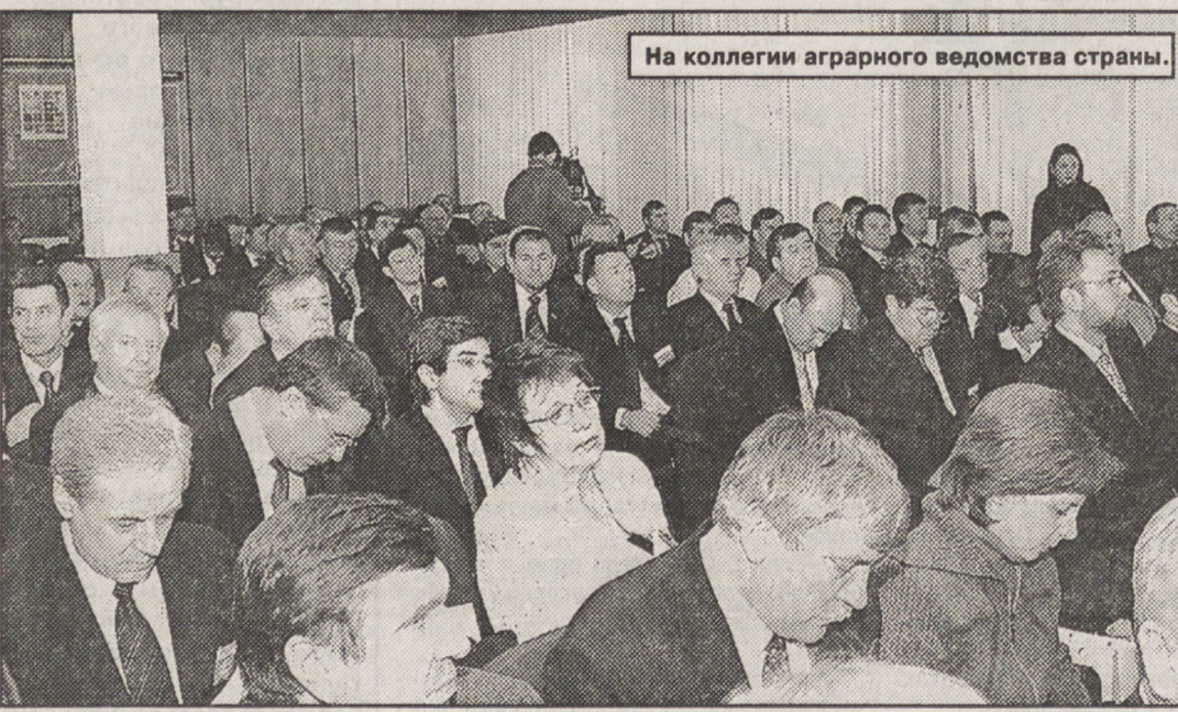
На коллегии аграрного ведомства страны.