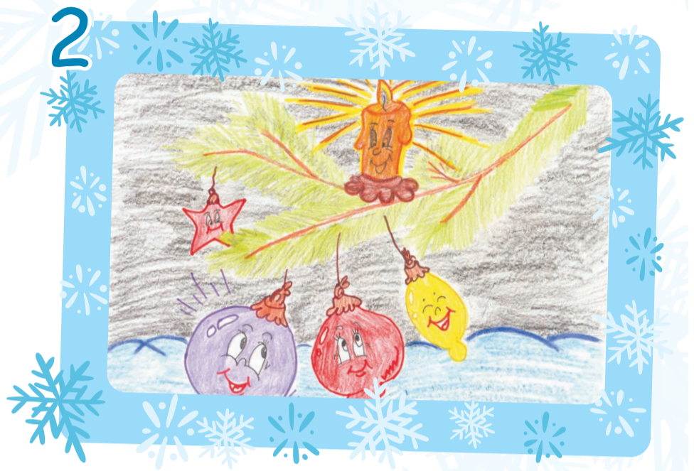
Федерягина Соня, 6 лет