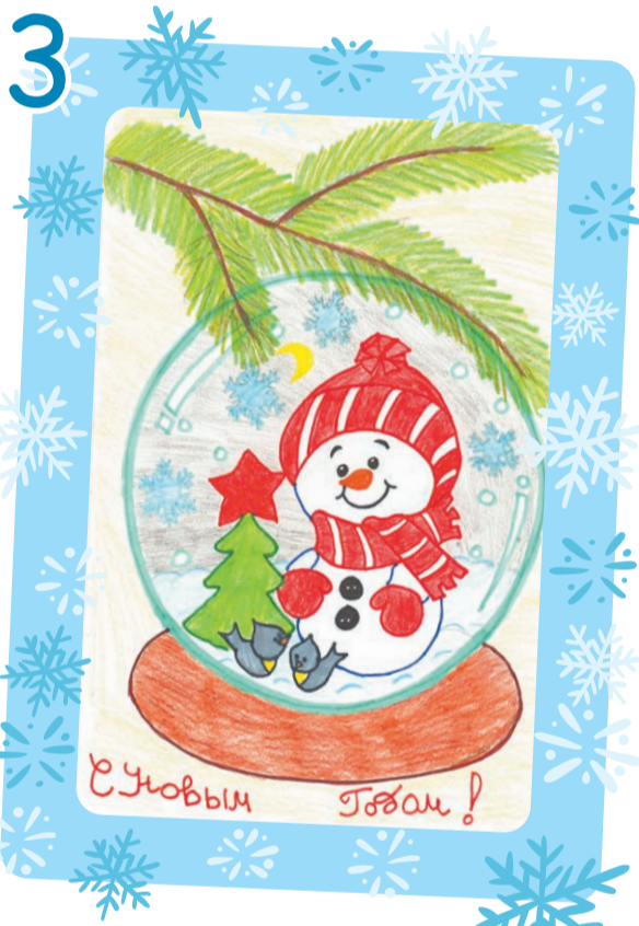
Федерягин Тимофей, 10 лет