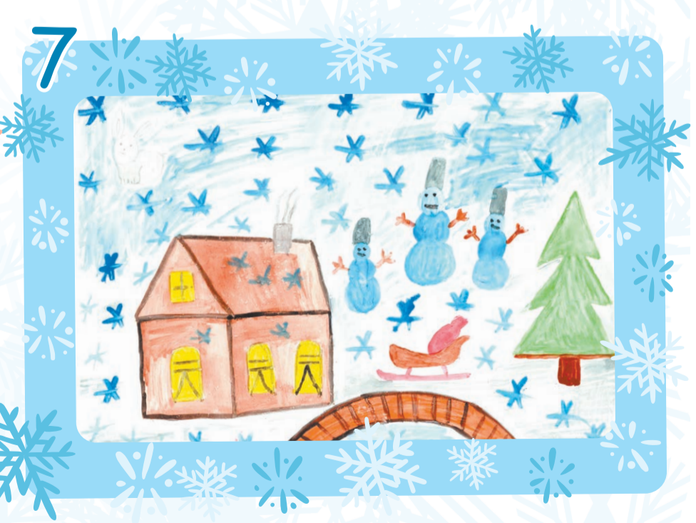
Бендер Софья, 4 года