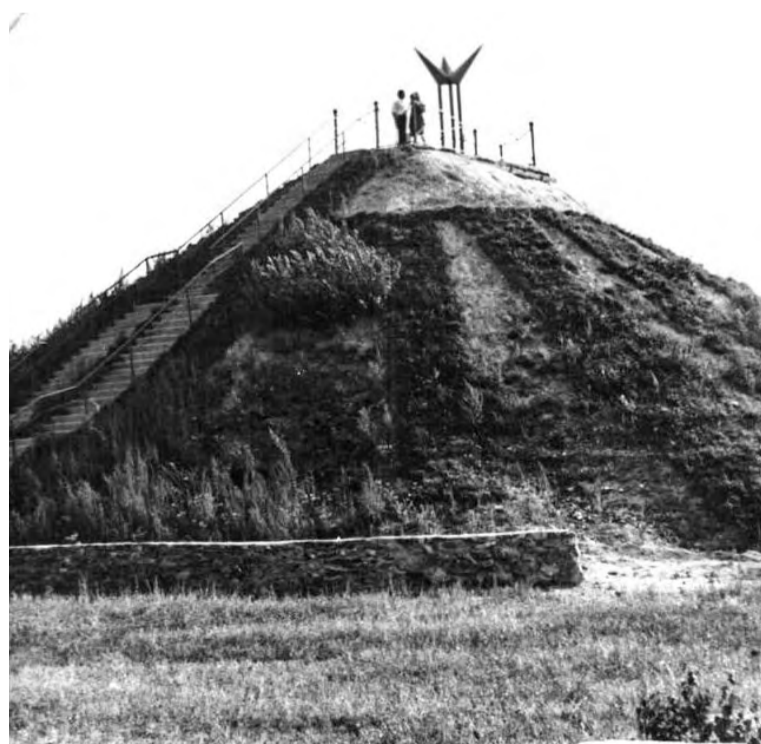
Курган горняцкой славы до наших дней не сохранился, памятник трудовой и революционной горняцкой славы остался только в воспоминаниях старожилов и на старых фотографиях...