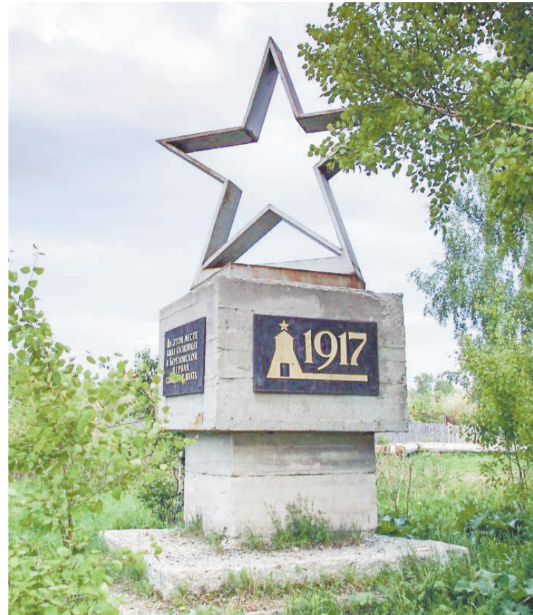
Памятный знак на месте Первой Советской шахты сегодня можно увидеть в районе автостанции, правда, в весьма непрезентабельном состоянии

Так, в годы первых пятилеток в районе нынешней автостанции возник новый Советский промышленный комплекс золото-