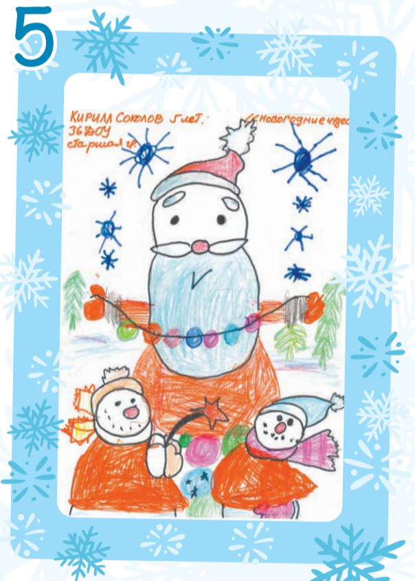
Соколов Кирилл, 5 лет