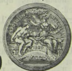
Золотая медаль, Парижъ 1889 г.

Вioletъ де-Шармъ. Гіацинтусъ. Жасминъ. Иланъ-Иланъ.