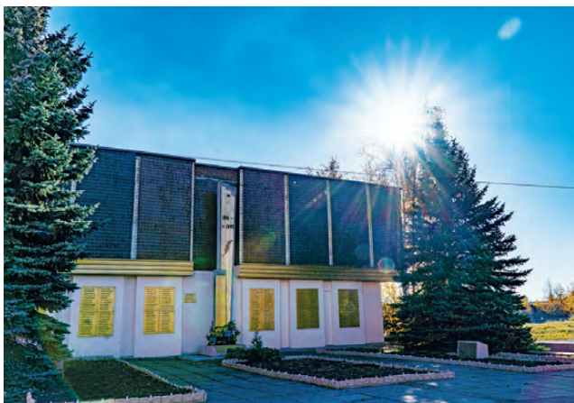
фасад заводского музея. 2021 год.