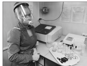
В лаборатории предприятия

карьера. Следующий этап – в 2022 г. снятие плодородного слоя почвы под объектами строительства и ее складирование для будущей рекультивации земель. Параллельно приступим к созданию производственной инфраструктуры и санитарно-бытового корпуса