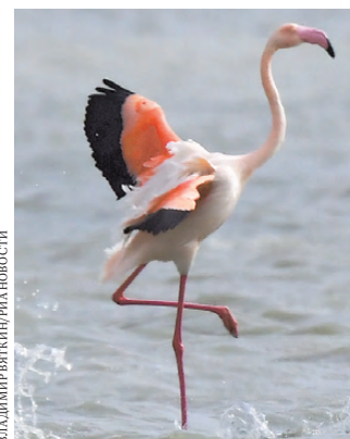
Розовый фламинго—очень грациозная птица.