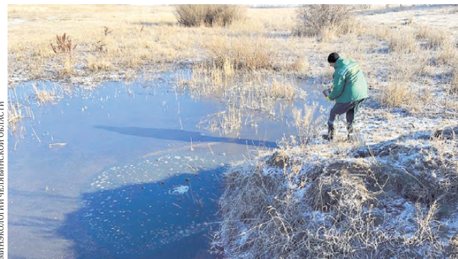
Отходы мясокомбината стекали с полей в реку.