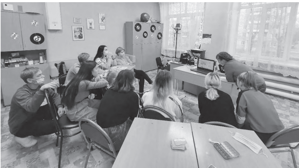
Показ учебных фильмов

Отдельное внимание в рамках месячника было уделено штабной тренировке по гражданской обороне на тему «Организация выполнения мероприятий по гражданской обороне на территории городского округа Красноуральск», в ходе которой была проанализирована и оценена реальность планов гражданской обороны и защиты населения городского округа Красноуральск. К тренировке с руководящим составом гражданской обороны были привлечены ОМВД России по городу Красноуральску, скорая медицинская помощь ГАУЗ СО «Красноуральская городская больница», 163 ПСЧ ФКУ 46 ОФПС по Свердловской области, ЕДДС городского округа Красноуральск.