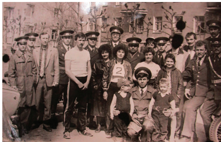
Коллектив ОВД отмечает победу в легкоатлетической эстафете 9 Мая

В настоящее время мы проводим оперативно-профилактическое мероприятие «Стоп, мошенник!». Поскольку чаще всего в сети телефонных мошенников попадают жители возраста 65+ (в нашем городском округе проживает более 5 тысяч таких граждан), мы поставили перед