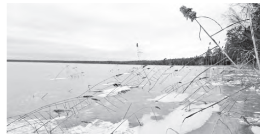
Дыхание зимы: постепенно надвигаются холода

- В эти дни многие рыбаки идут на водоемы, хотя лед еще недо-