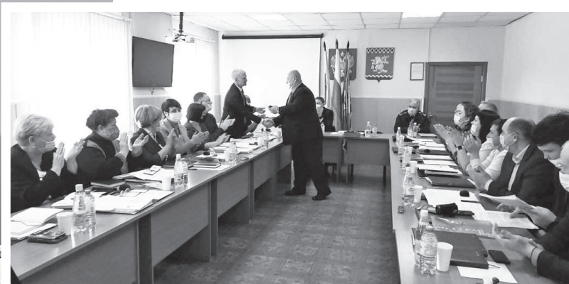
На заседание Думы пришли 20 депутатов. Почти по всем вопросам голосовали единогласно

Вчера депутаты Думы 7 созыва собрались на второе заседание, оно было перенесено с прошлого месяца.