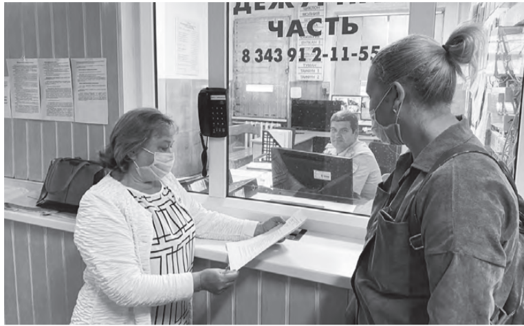
С гражданами - вежливо

В рамках проверки отмечено наличие информационных стендов для граждан с указанием контактных телефонов, алгоритмом подачи документов и порядка действий по получению госуслуг. Кроме того, исправно работает система электронной очереди. Граждане, воспользовавшиеся госуслугами через Интернет, приходят к назначен-