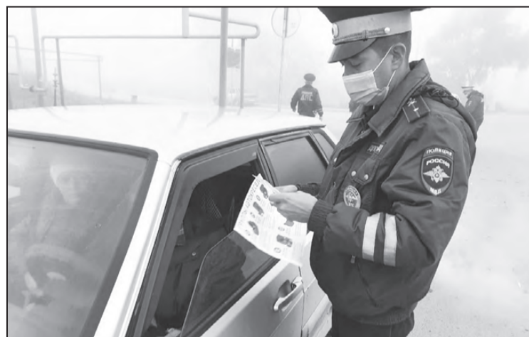
Проверка на дорогах.

Осенние каникулы – это не только время отдыха, это еще и время, когда наибольшее количество детей и подростков имеет наименьший контроль со