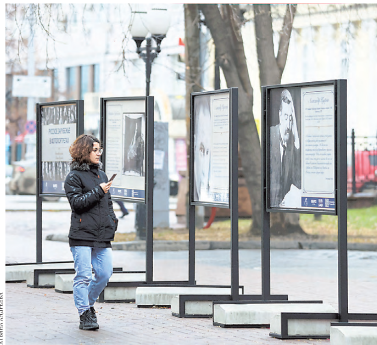
Выставка всемирно известного фотохудожника Петра Шумова «Русское зарубежье в фотопортретах» — лишь один из проектов Всероссийского фестиваля «Русское зарубежье: города и лица».