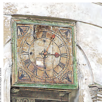
Один из героев музейного проекта — часы на колокольне Никольской церкви в Быньгах.

— То, что случилось с часами в Мраморском, было трагедией: после 150 лет существования они пострадали в аварии — в них врезался пья-