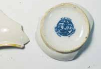
Фрагмент фарфоровой посуды с клеймом