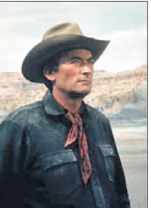
20.40 Х/ф «Золото Маккены» (12+) 22.45 Летний концерт в парке дворца Шёнбрунн

19.50 Д/с «Мировая литература в зеркале Голливуда»