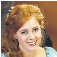
СТС • 23.25 «Зачарованная» (12+)

04.55 Т/с «Поздний срок» (16+) 06.10 Поздний срок (16+) 07.00 Доброе утро. Суббота 09.00 Умники и умники (12+) 09.45 Слово пастыря (0+) 10.15 Т/с «Воспоминания о Шерлоке Холмсе» (12+) 12.10 Т/с «Воспоминания о Шерлоке Холмсе» (12+) 16.40 Кто хочет стать миллионером? (12+) 17.55 «Горячий лед». Гран-при 2021 г. Турин. (0+) 18.50 Сегодня вечером (16+) 21.00 «Время» 21.20 Сегодня вечером (16+) 22.10 Что? Где? Когда? 23.25 Х/ф «Генералы песчаных карьеров» (0+) 02.25 «Горячий лед». Гран-при 2021 г. Турин. Фигурное катание. Женщины. Произвольная программа (0+)