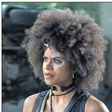
СТС • 22.00 «Дэдпул 2» (16+)