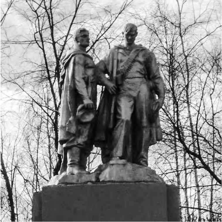
Памятник красногвардейцам во дворе МТРЗ