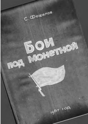
Обложка книги Степана Фефелова «Бои под Монетной»

Дорого заплатили и белые за свою победу. Много чехов после