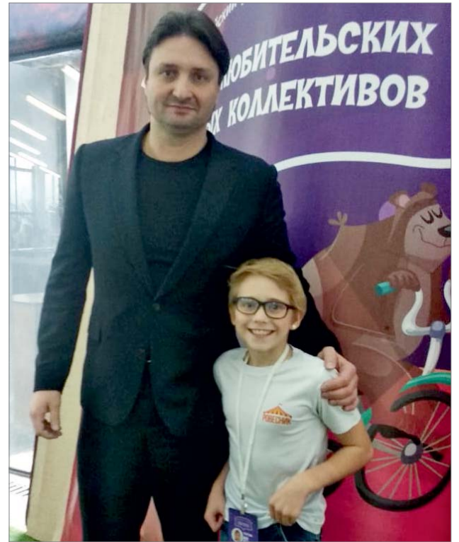
Снимок на память с председателем жюри Э.Запашным.

В течение двух конкурсных дней жюри просмотрело 55 цирковых но-