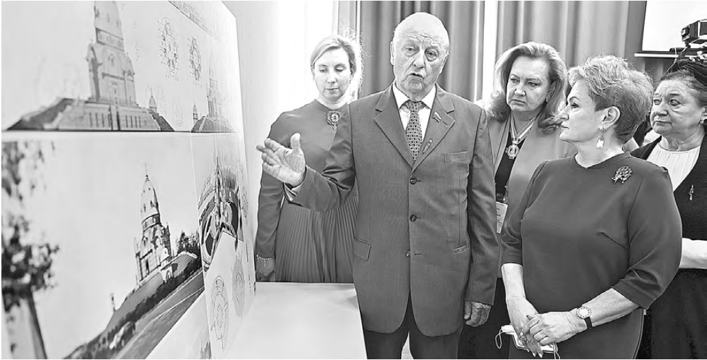
Эдуард Россель поделился планами развития музейного комплекса горнозаводской цивилизации с участниками Демидовской ассамблеи.

—Нужно чтобы областные и федеральные структуры уже сегодня согласовали с собственниками передачу этого объекта музею. Конечно, он должен быть приведен в порядок, превращен в музей-шахту. Останавливаются устаревшие цеха на Нижнетагильском металлургическом комбинате, но их тоже нельзя сносить, — убежден он. — Я боюсь, что может получиться, как сукоколейной железной дорогой до Висимо-Уткинской, построенной в 1895 году, 67 километров по красивейшим местам! Когда в 2008 году ее разбирали, разрезали демидовские рельсы, никто из Тагила — ни администрация, ни интеллигенция — не подняли вопрос о ее сохранении. Мы нашли деньги, купили бы эту дорогу! Узкоколейка проходила по местам, где как раз сейчас создадут крупнейший на Урале туристический комплекс, и есть планы восстановления утраченной дороги как одной из исторических достопримечательностей и использования ее для удобного передвижения гостей. ●