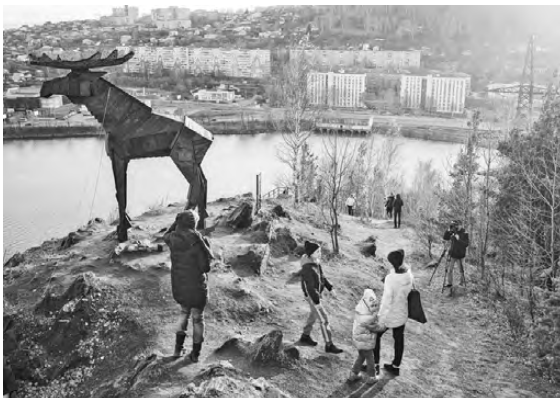
С вершины Косотура открывается прекрасный вид на Златоуст.

В Златоусте открыли новую экотропу — подъем на гору Косотур, с которой открывается красивый вид на центр города оружейников. Новый маршрут появился благодаря общественным инициативам — в прошлом году один из местных предпринимателей получил на его создание грант Ростуризма. В результате у подножия горы появились парковка и яркая входная группа, были установлены лестничные марши и информационные аншлаги, смонтированы две смотровые площадки. Волонтеры очистили скалы от вандальных надписей, а художники украсили вершину Косотура деревянной фигурой лося, созданной по мотивам сказов об Урале. Новая тропа уже бьет рекорды по популярности туристического трафика. Восхождение на Косотур туристы совмещают с экскурсиями в краеведческий музей или на оружейную фабрику.