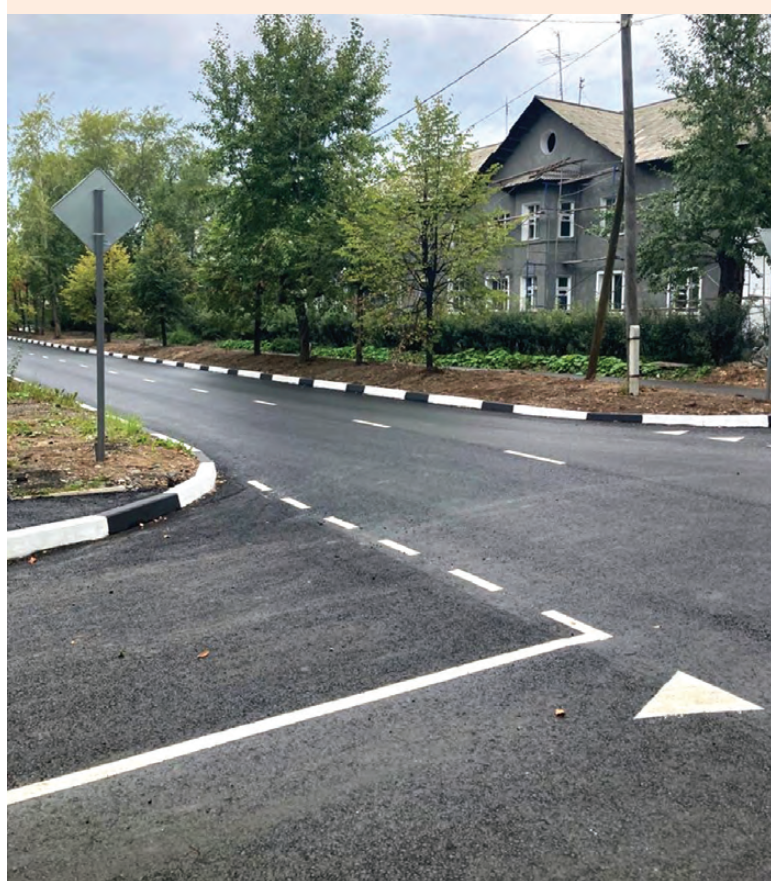
Автомобильная дорога по улице К. Маркса