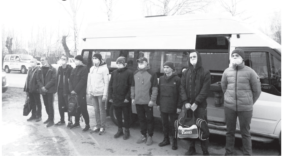
Семь красноуральских и три кушвинских призывника перед отправкой в областной сборный пункт в Егоршино

В минувшую среду, 20 октября, первых красноуральских новобранцев осеннего призыва торжественно проводили в областной сборный пункт в Егоршино.