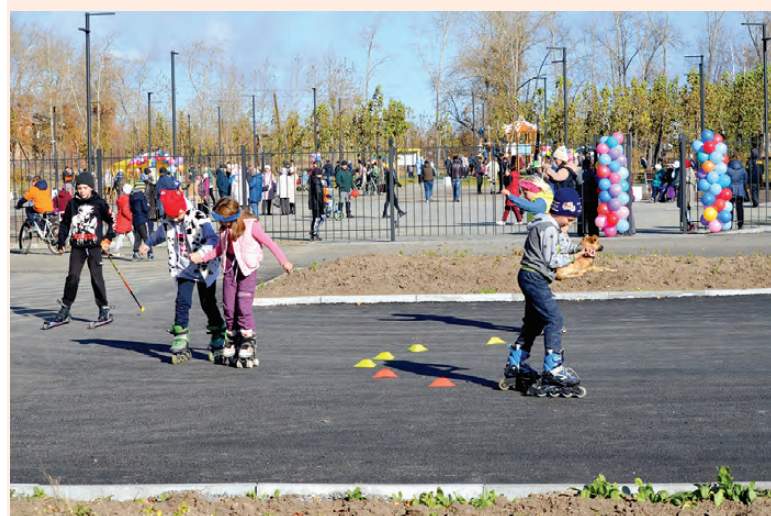
Сквер «Парк искусств»