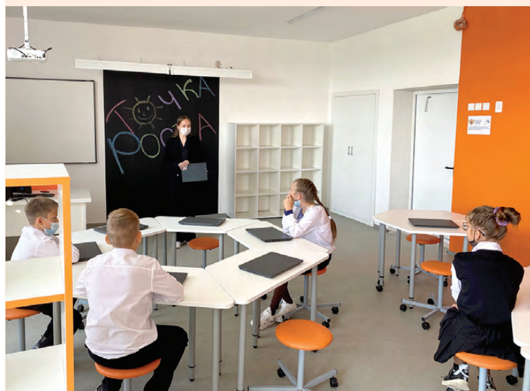
Центр образования «Точка роста» в школе №6