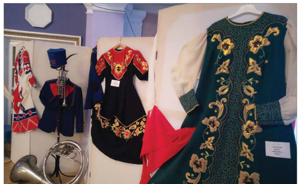
Выставка костюмов и инструментов напомнила, как всё начиналось.

- Пела в «Сударушке», «Россиянах». Я на Динасе живу с 1946 года. Когда была маленькой, мы – «дети пожарной команды», ходили в залу для отдыха, которая была в заводской пожарке. В этом помещении стояла радиолка. В наших семьях ничего подобного ещё не было, поэтому мы с радостью учились танцевать, пели. Жила тогда там семья