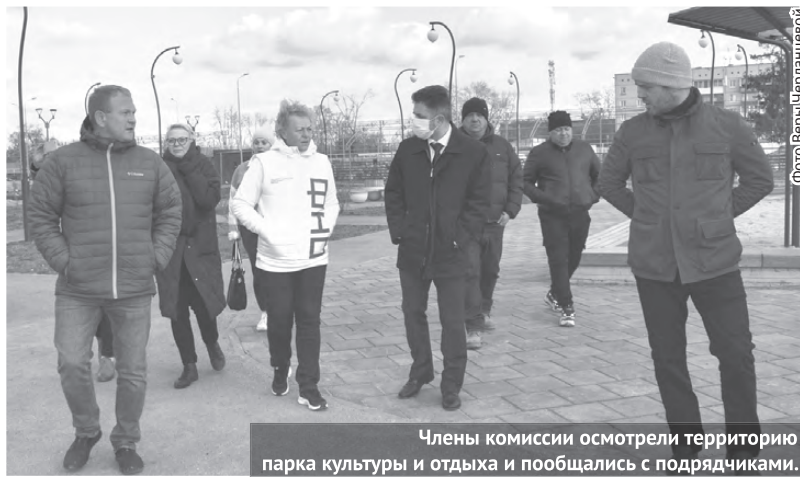
Члены комиссии осматривали территорию парка культуры и отдыха и общались с подрядчиками.

В Свердловской области завершилась выездная проверка Минстроя РФ и Общероссийского народного фронта (ОНФ) по реализации федерального проекта «Формирование комфортной городской среды». Инспекторы провели мониторинг благоустройства 21 общественной и 16 дворовых территорий в десяти городах, в том числе и в Богдановиче