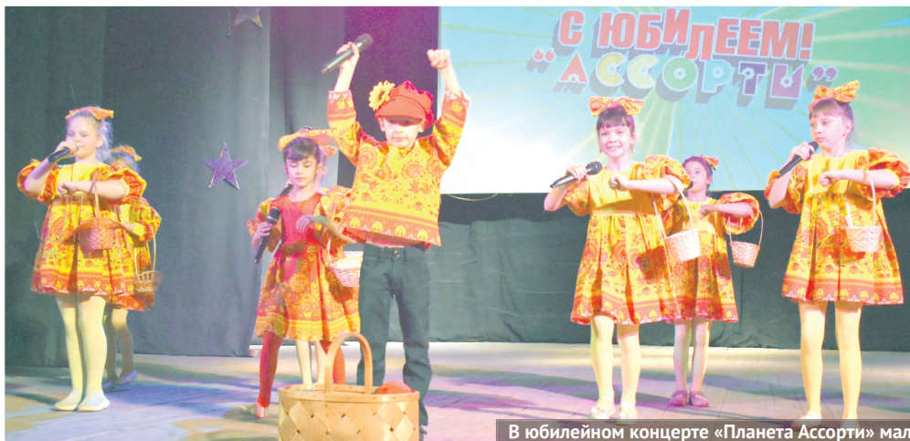
В юбилейном концерте «Планета Ассорти» маленькие таланты показали высокий класс.