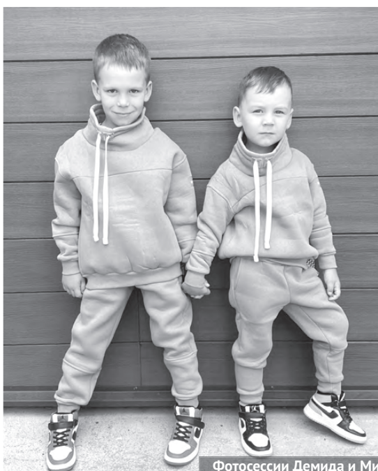
Фотосессии Демиды и Мирона - вклад в общее дело.