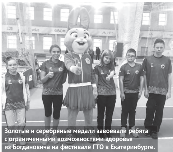
Золотые и серебряные медали завоевали ребята с ограниченными возможностями здоровья из Богдановича на фестивале ГТО в Екатеринбурге.

В екатеринбургском спорткомплексе «Луч» состоялся большой праздник ГТО, в котором приняли участие команды трудовых коллективов и людей с ограниченными возможностями здоровья