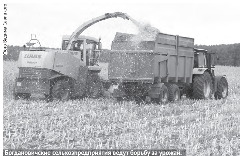
Богдановичские сельхозпредприятия ведут борьбу за урожай.

Несмотря на многочисленные трудности в этом году, представители одной из самых древнейших профессий на земле – работники сельского хозяйства ГО Богданович, будучи трудолюбивыми и преданными своему делу профессионалами, не собираются сдаваться. Хотя итоги сельскохозяйственной кампании по уборке урожая не слишком выдающиеся, но тем не менее жизнь продолжается