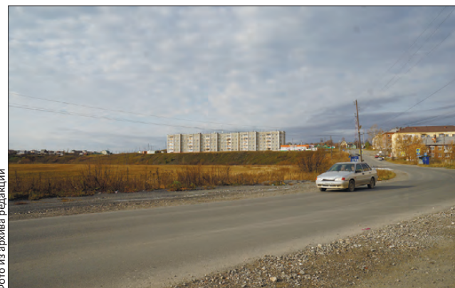
Дороги ремонтируются не только в городе, но и в СТУ

В минувший четверг «Вечерка» объявила новую акцию. В преддверии 290-летия любимого города, которое будет отмечаться в 2022 году, мы решили вспомнить, как преобразился Первоуральск с юбилея прошлого. Начнем наш рассказ, пожалуй, с самой популярной у горожан темы — дорожной.