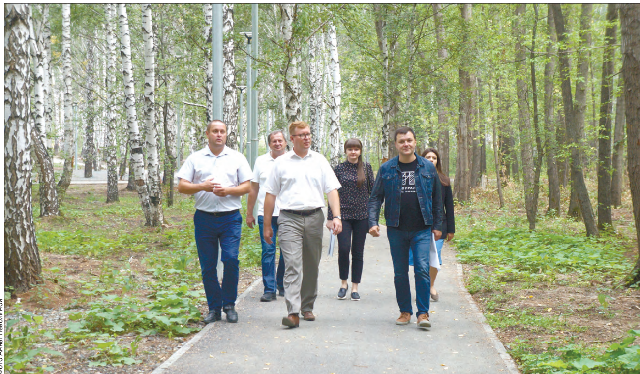
Подрядчик пообещал комиссии завершить работы к началу сентября