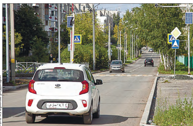
В первую очередь на ремонт ставят те, что ведут к школам, садикам и больницам

объем — 13 километров. Изменился и сам принцип ремонтной кампании. Город начал участвовать в целевых программах, предусматривающих поддержку областного бюджета, работы стартуют не ближе к концу лета, как прежде, а уже весной. К самому же ремонту стали подходить системно. «Обкатали» метод во время работ на проспекте Космонавтов в 2015 году: прежде, чем менять асфальтовое покрытие, отремонтировали