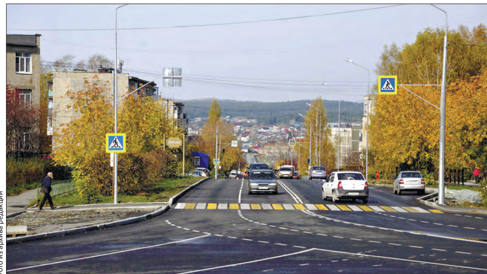
Первой дорогой, где был сделан комплексный ремонт, стал проспект Космонавтов

проходящие под дорожным полотном коммуникации и систему освещения, поставили новые светофоры.