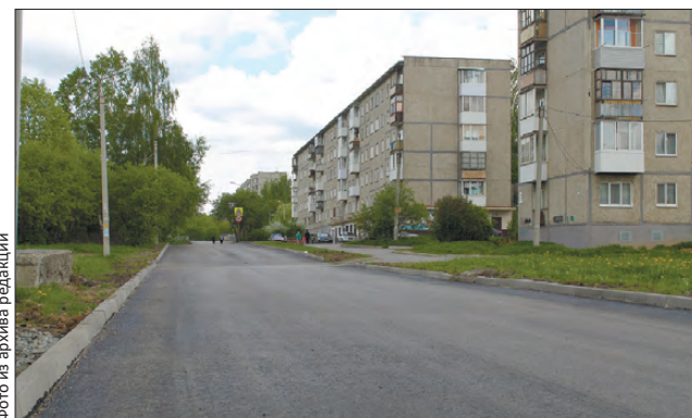
Внутриквартальным проездам теперь тоже уделяется внимание