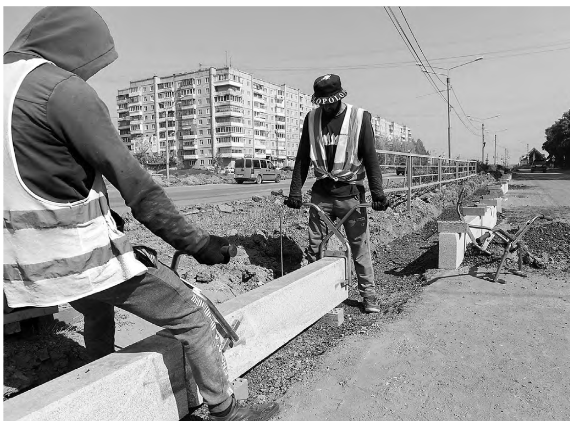
Установка бордюрного камня.

– На протяжении двух лет муниципалитет успешно справляется с задачами нацпроекта по модернизации дорожно-транспортной сети. Этот год тоже не