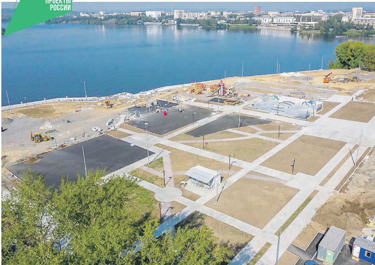
Строительство "Тагильской лагуны-2" идет полным ходом.

«Тагильская лагуна-2», ориентировочно, будет готова к 15 октября. При условии, что погода позволит подрядчикам не снижать набранный темп работ. Срок сдачи объекта по контракту – 1 ноября.