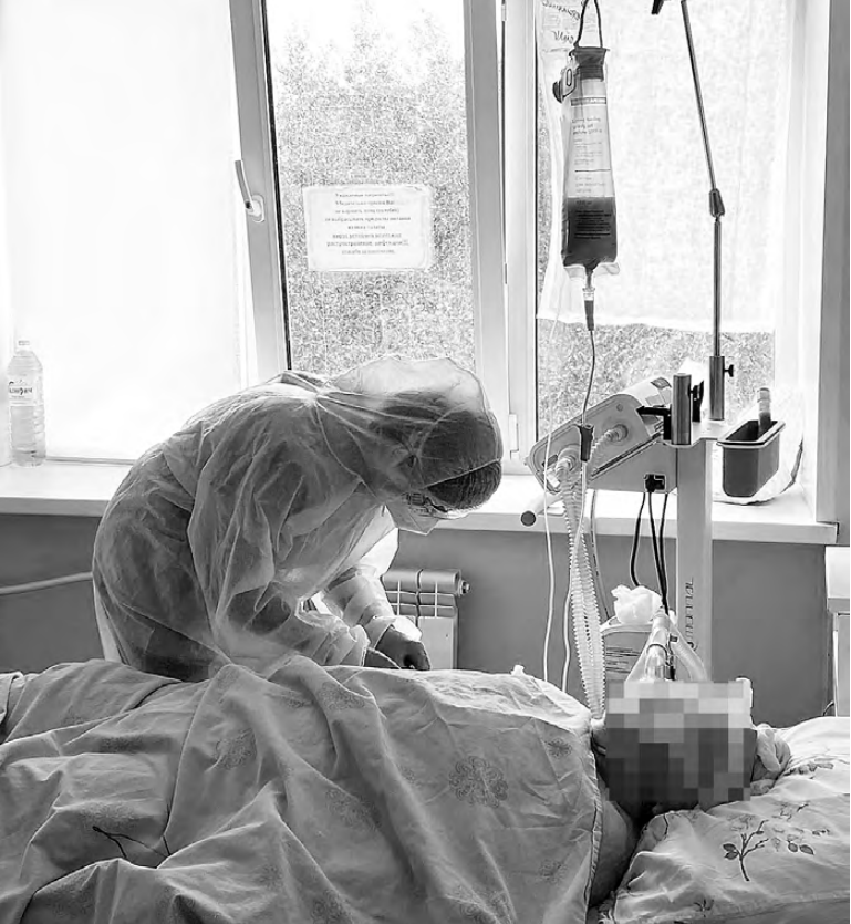
В «красной зоне».

- Даже при легком течении болезни, когда имеется выраженная слабость, человек не может передвигаться и обслуживать себя. Но при этом у него отсутствует нарушение витальных функций: нет никаких дыхательных проблем, - сказал Константин Аникин. - Пациент субъективно воспринимает это течение, как крайне тяжелое, потому что ему тяжело двигаться. Но для нас это легкая форма, потому что тяжелая протекает несколько иначе. Тяжелые пациенты находятся на искусственной вентиляции, на вспомогательном дыхании.