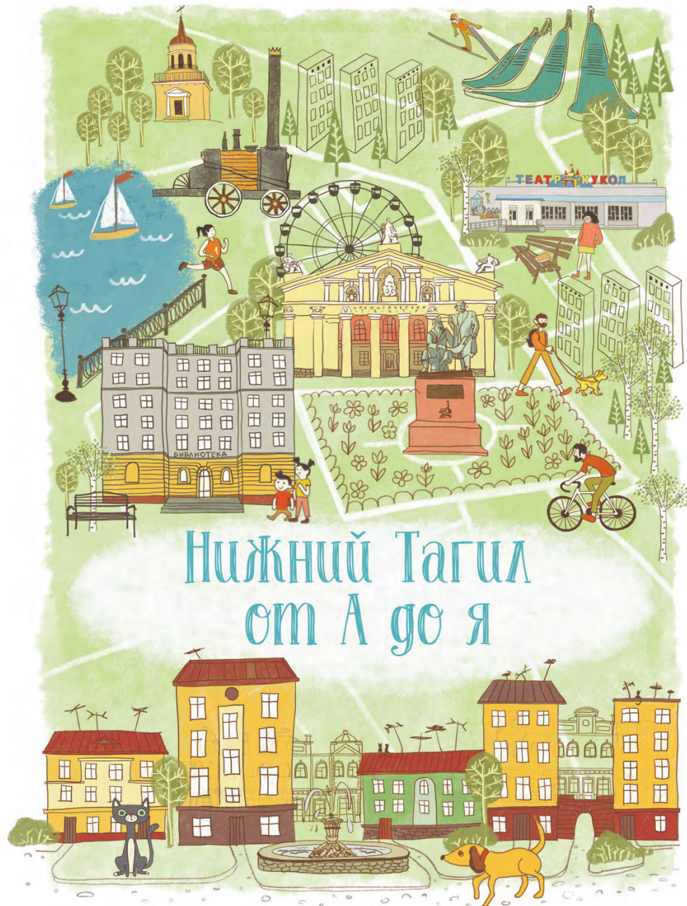
Вариант обложки книги для детей о Нижнем Тагиле.