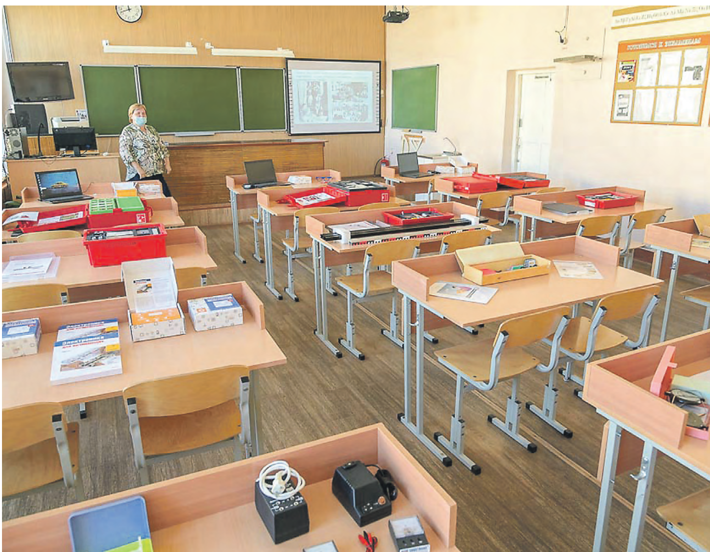
Здесь будут учиться будущие врачи.

До начала нового учебного года остаются считанные дни, и многие родители, отправляя детей в школу, хотят знать, готовы ли образовательные учреждения к приему детей, ждут ли ребят просторные классы с удобной школьной мебелью и снабжены ли они необходимым оборудованием.