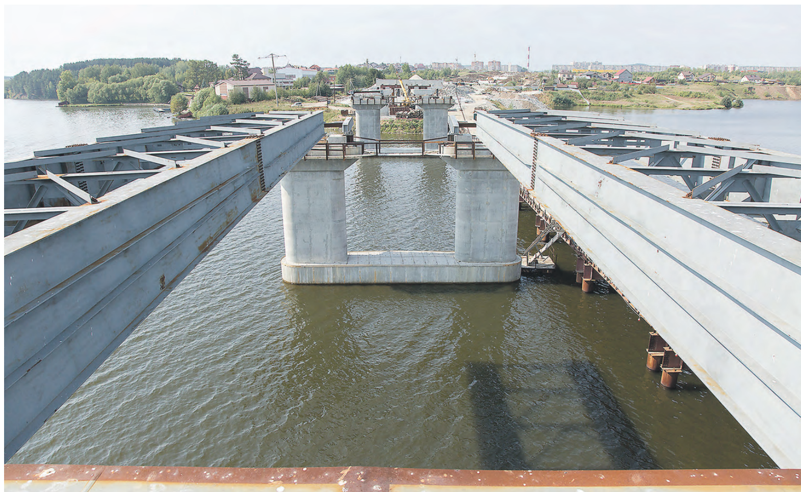
К началу октября завершится надвижка моста.