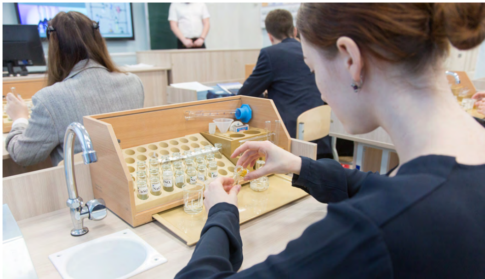
Уникальная лаборатория в школе №85.

– Сегодня все говорят о кадровом дефиците, о катастрофической нехватке учителей.