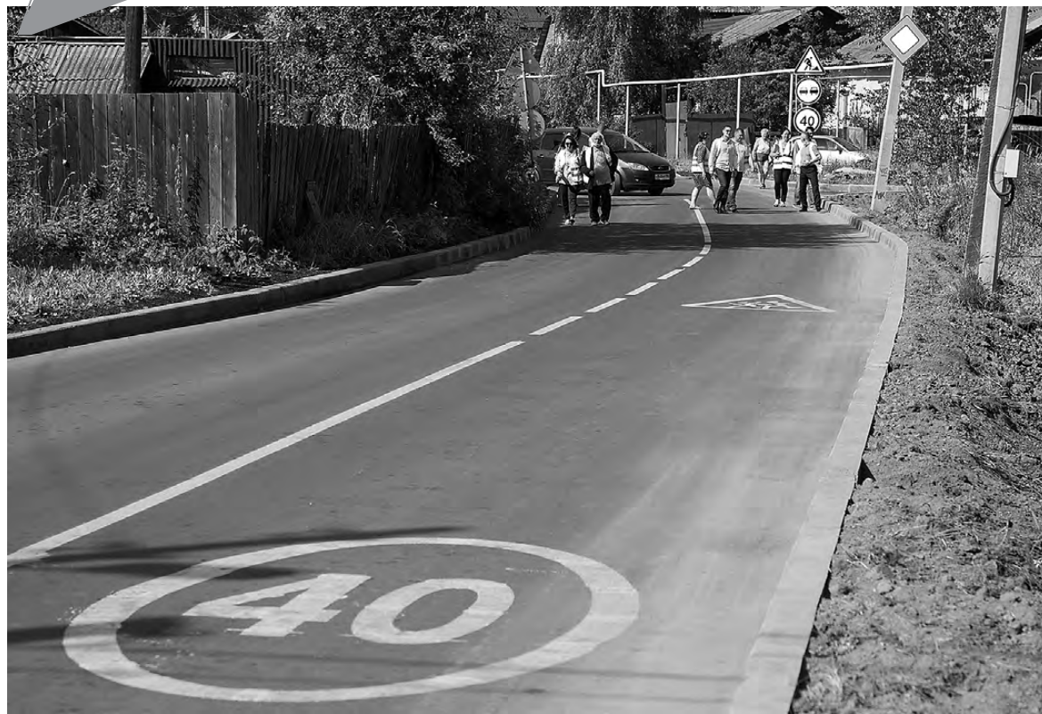
Улица Калинина после ремонта.

Дорога на улице Калинина в Дзержинском районе Нижнего Тагила отремонтирована. Качество выполненных работ проинспектировала комиссия по приемке. Ее участники и журналист "ТР" прошли с инспекцией весь участок нового дорожного полотна.