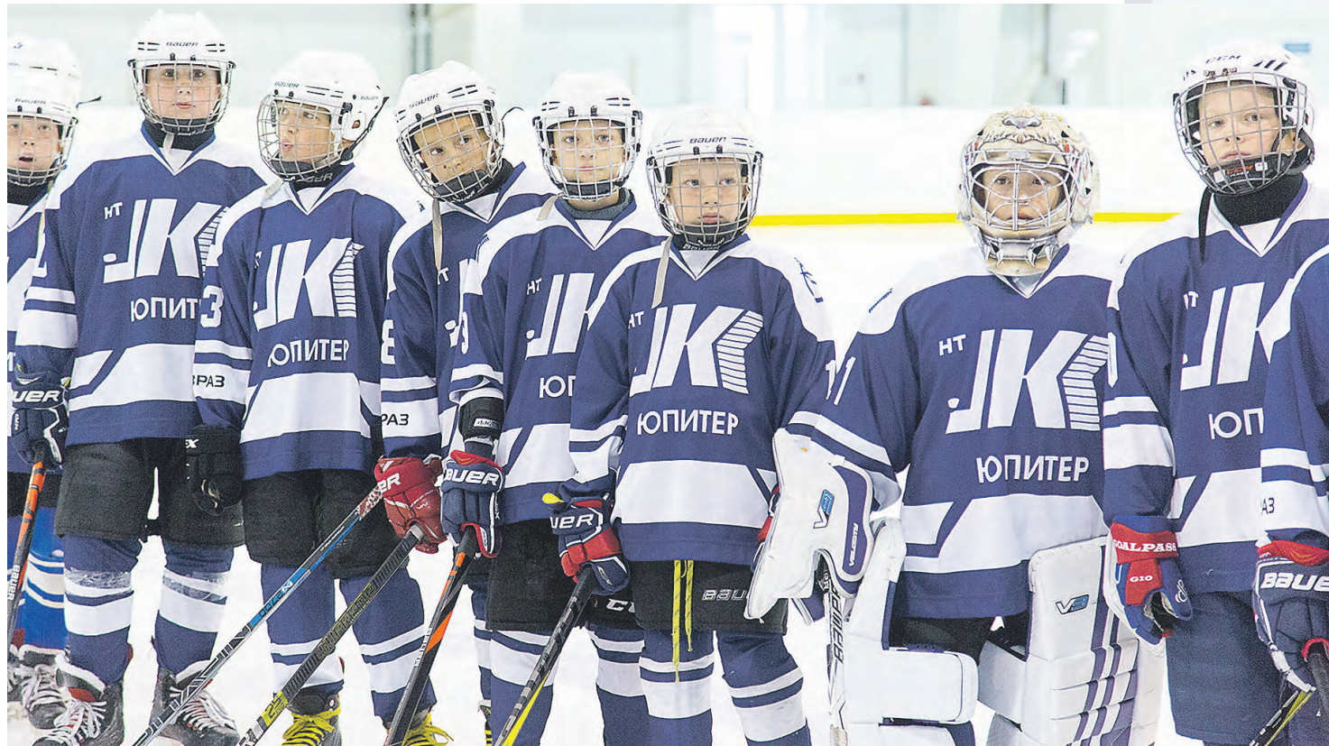
«Кристалл-Юпитер-2010» на своем льду завоевал «бронзу».