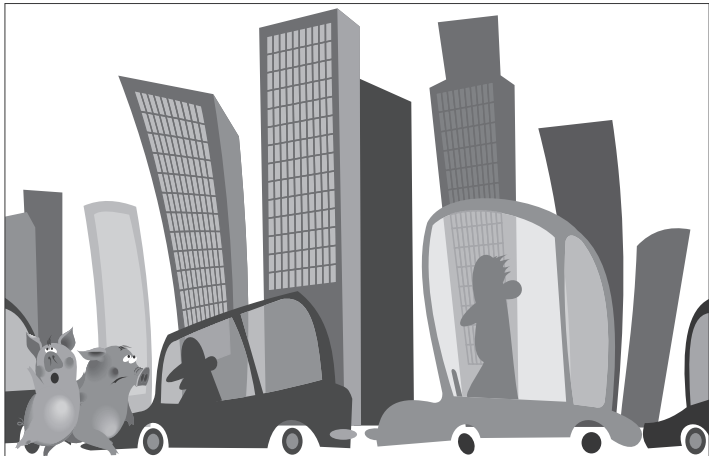
Иллюстрация Петра УПОРОВА.

О свинье на дороге в полицию сообщила женщина, ставшая свидетельницей падения животного из грузовика. Оказавшись на шоссе, свинья отправилась прогуляться, и вскоре в районе появления парнокопытного образовалась пробка протяженностью около пяти километров. На место происшествия выехали полицейские, которые поймали свинью с помощью сети. Позднее на другой автодороге, в городе Кобе, был пойман другой поросенок. Предположительно, он выпал из