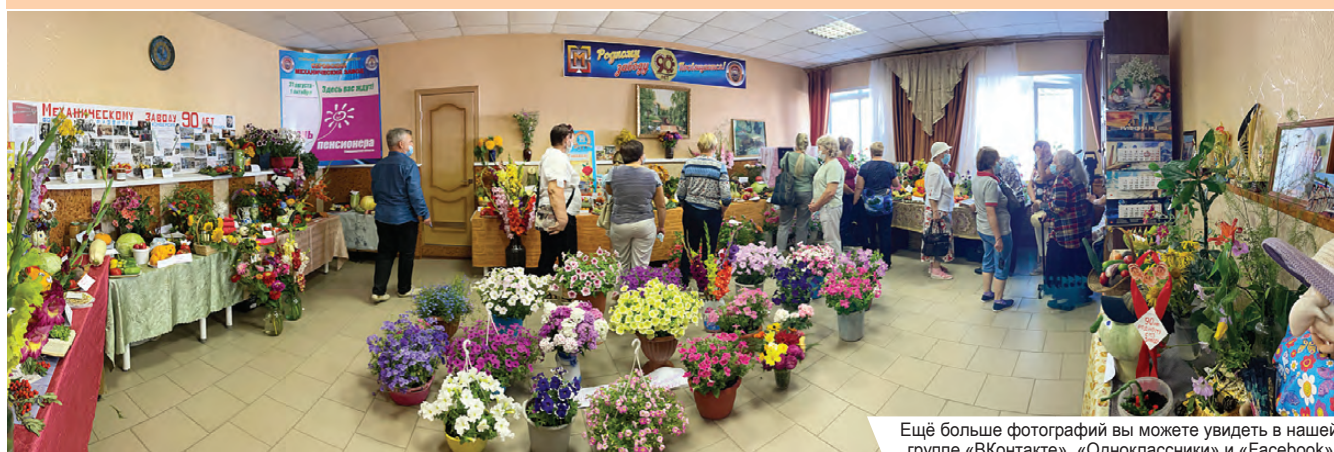
Ещё больше фотографий вы можете увидеть в нашей группе «ВКонтакте», «Одноклассники» и «Facebook».